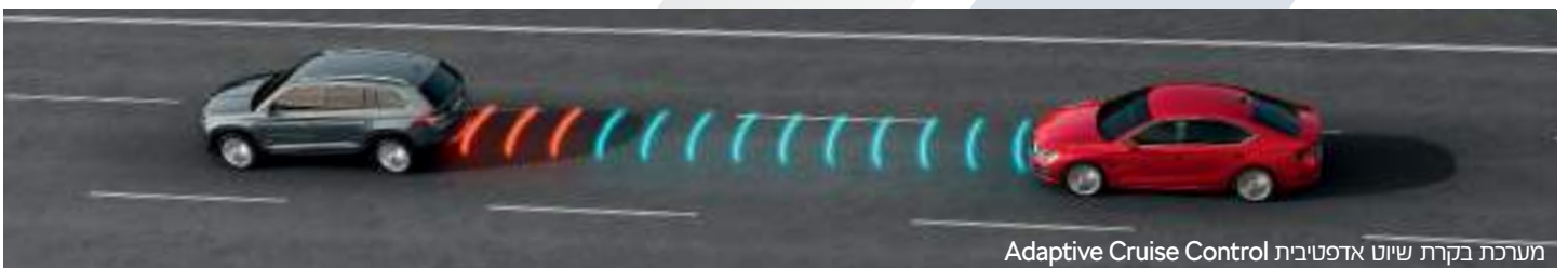
מערכת בקרת שיוט אדפטיבית Adaptive Cruise Control