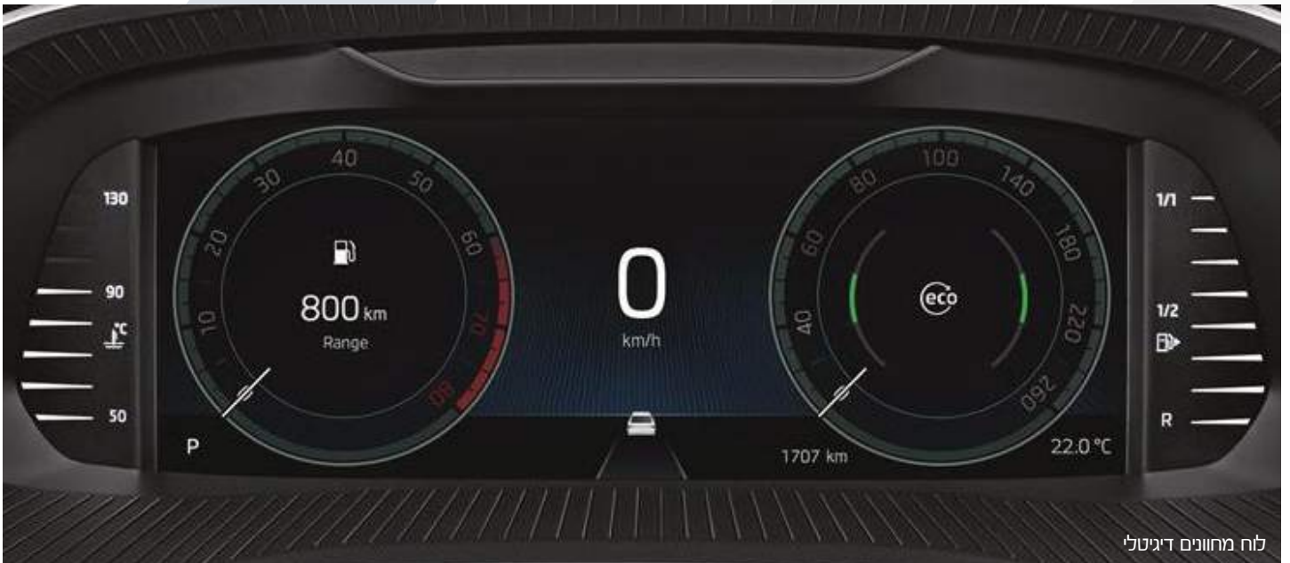
לוח מחוונים דיגיטלי