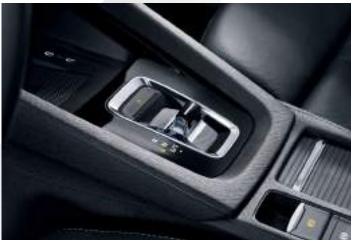
בלם יד חשמלי ו-Shift by wire

עוגנים למושב בטיחות לילדים, כולל במושב הנוסע הקדמי