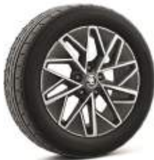
רמת גימור Dynamic 17"