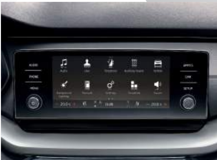
מערכת מולטימדיה Swing

*חלק מיכולות המערכות תלוי בטלפון הנייד ובזמינות האפליקציות השונות בישראל על תנאיהן ומגבלותיהן