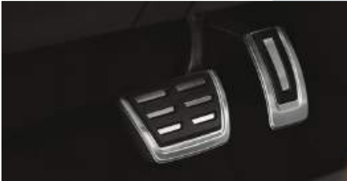
דושות בחיפוי דמוי אלומיניום