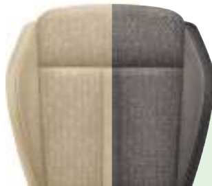
CB/BG רמת גימור Style