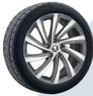
רמת גימור Style 18"