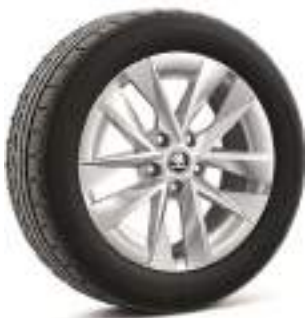
רמת גימור Ambition 17"