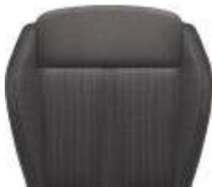
AH רמת גימור Dynamic