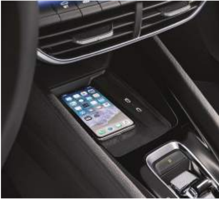
תא ייעודי לטלפון הנייד עם טעינה אלחוטית