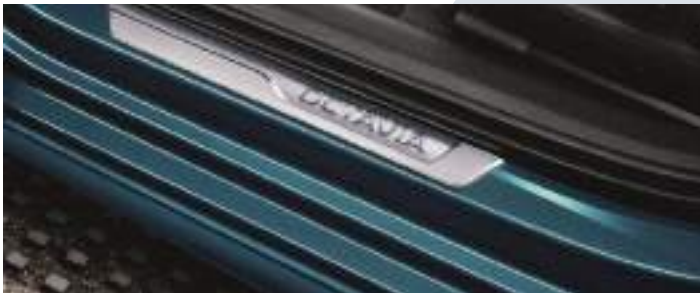
ספי דלתות מעוצבים