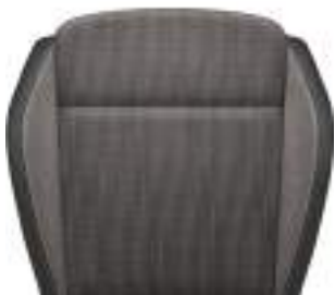
BG רמת גימור Ambition