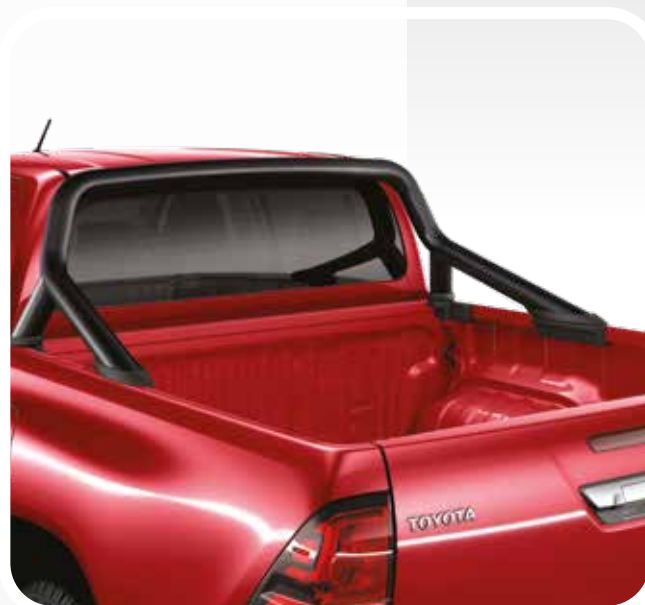
קשת הגנה דקורטיבית לארגז בצבע שחור