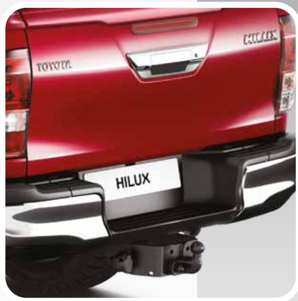
ו גרירה משולב