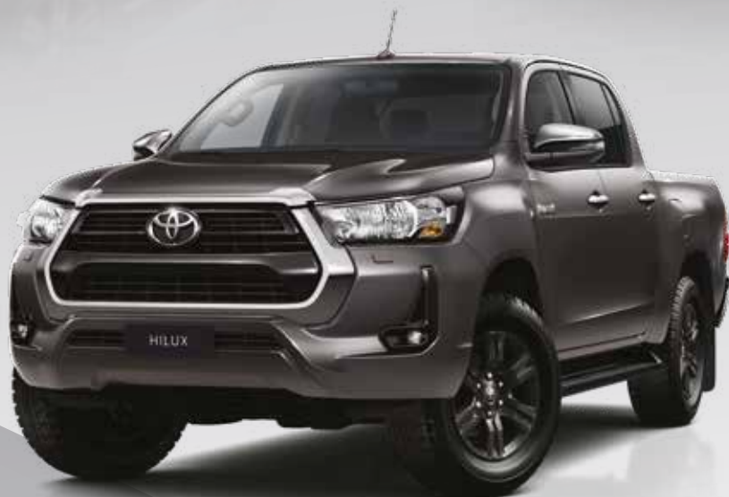
אפור כהה מטאלי 1G3