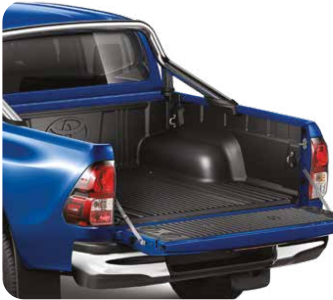
משטח הגנה קשיח מפלסטיק לארגז כולל כיסוי דפנות ודלת ארגז