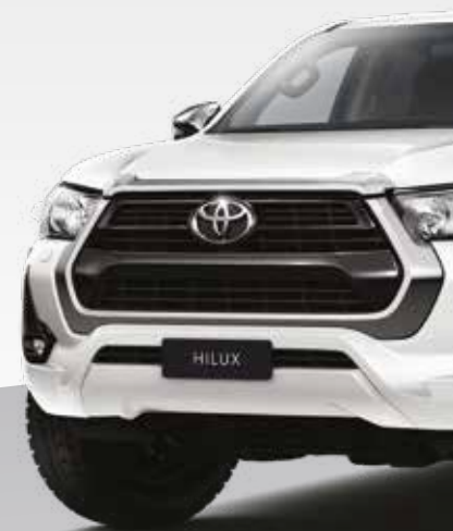
לבן צחור 040