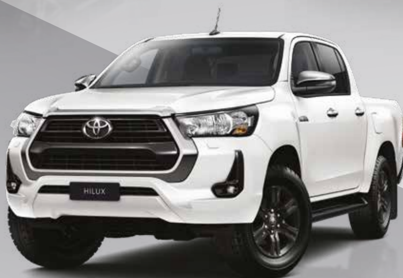
לבן פנינה מטאלי 070