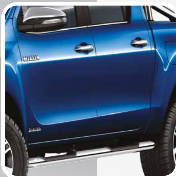
מדרגות צד מהודרות מפלדת אל חלד