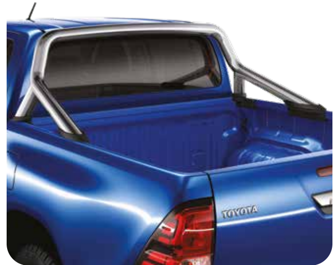
קשת הגנה דקורטיבית לארגז בצבע ניקל