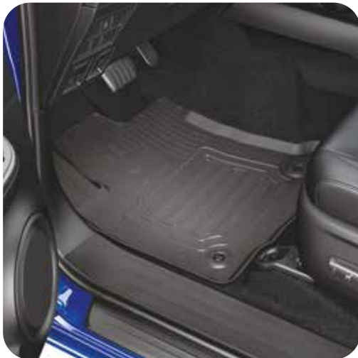
סט 4 שטיחי גומי בצבע שחור