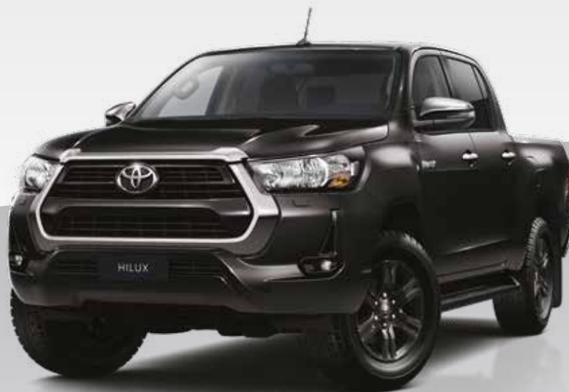
שחור מיקה מטאלי 218