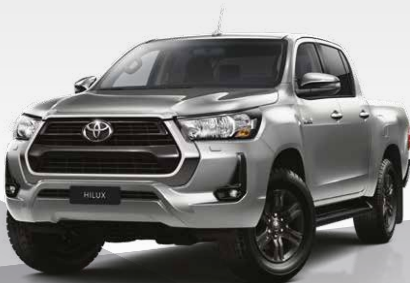
כסוף מטאלי 1D6