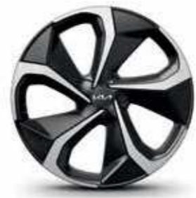
חישוקי סגסוגת 20 אינץ' (GT-line)