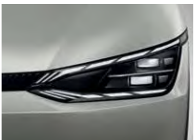
פנסים ראשיים IFS LED (בדגם GT-Line)