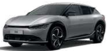
Moonscape (KLM)* צבע בתוספת תשלום*