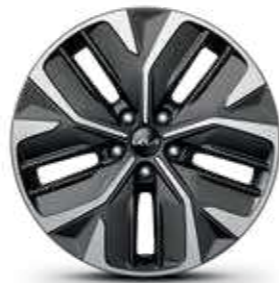
חישוקי סגסוגת 19 אינץ' (Premium)