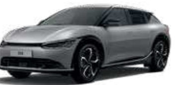
Iron Gray (KLG)