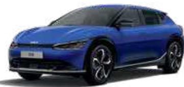
Yacht Blue (DU3)