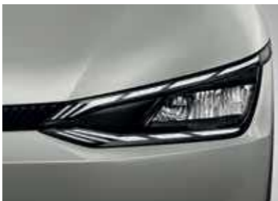
פנסים ראשיים MFR LED (בדגם Premium)