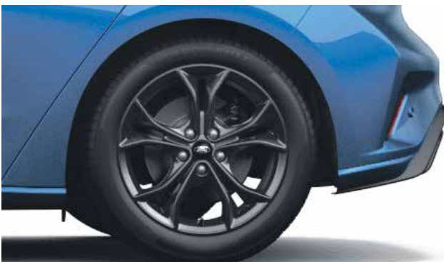
חישוקי סגסוגת קלה 17"