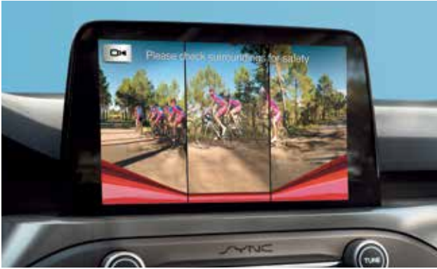
מצלמת נסיעה לאחור 180° עם טווח ראייה רחב