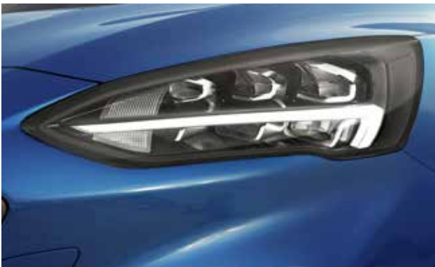
פנסי חזית מסוג LED