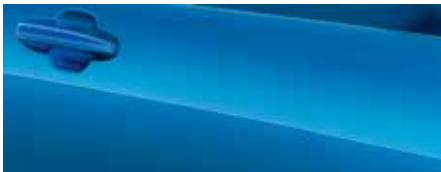
כחול מרוצים (FCI)