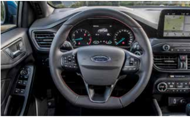
הגה ST קטום