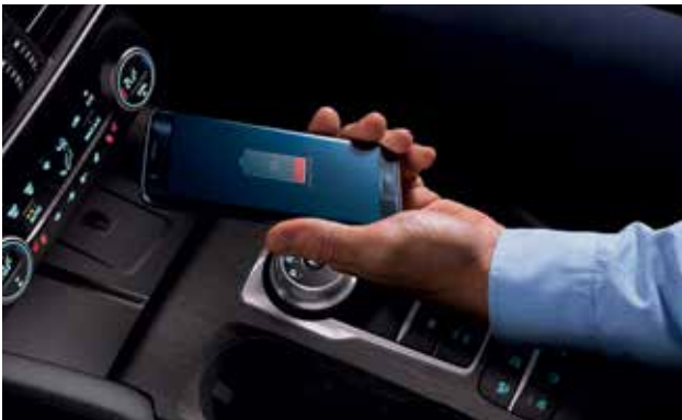
משטח טעינה אלחוטי*