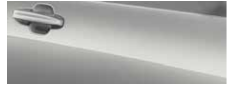
כסף מטאלי (FCO)