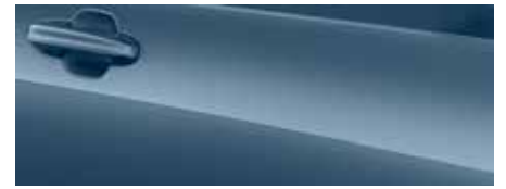
כחול כרום (FCC)