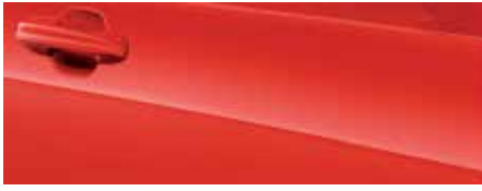
אדום מרוצים (FCZ)