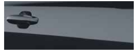
כחול עשיר (FCD)