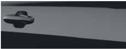
שחור מטאלי (FCA)