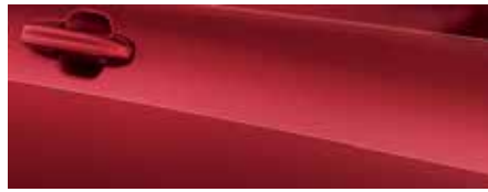
אדום לוחט* (FCF)