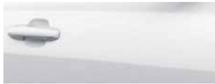
לבן קפוא (FC5)