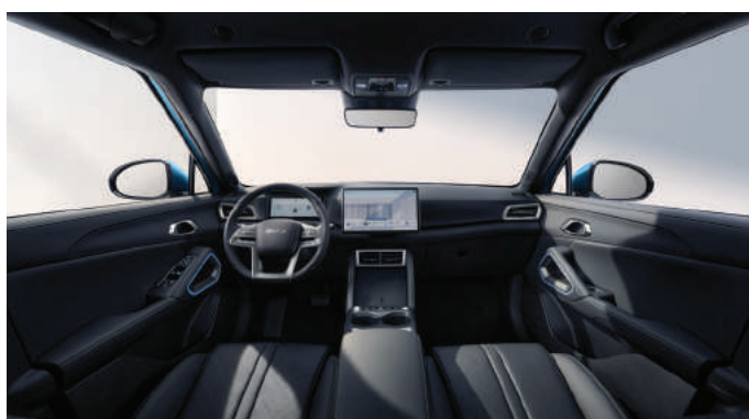
Black (Active, Boost גימור ברמת)