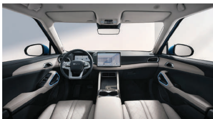
Beige (Boost גימור ברמת)