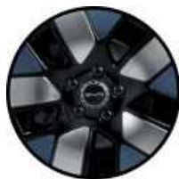
חישוקי סגסוגת אלומיניום בשילוב שלושה צבעים