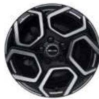
חישוקי סגסוגת אלומיניום בשילוב שני צבעים