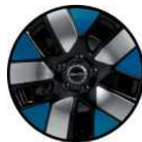
חישוקי סגסוגת אלומיניום בשילוב שלושה צבעים