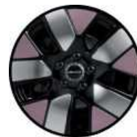
חישוקי סגסוגת אלומיניום בשילוב שלושה צבעים