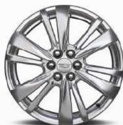
חישוקי אלומיניום 20" PREMIUM LUXURY