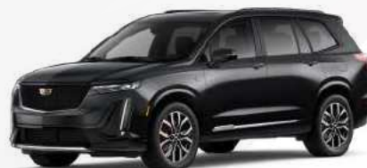
שחור כוכב מטאלי | G88