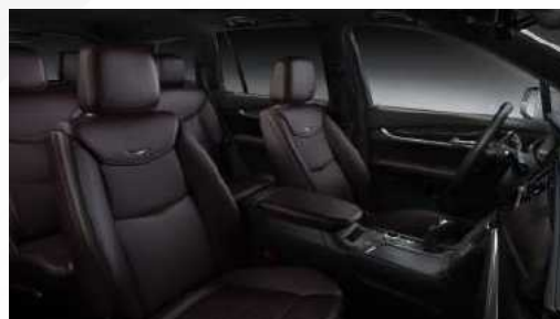
עור חום כהה עם דשבורד שחור דגם PREMIUM LUXURY