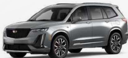
אפור סטרלינג מטאלי | GXD