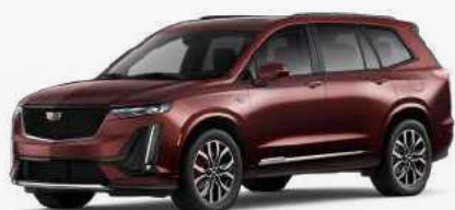
בורדו מטאלי | G6K