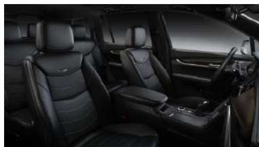
עור שחור עם דשבורד שחור דגם PREMIUM LUXURY / SPORT