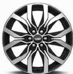
חישוקי אלומיניום 20" SPORT