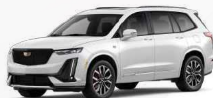
לבן קריסטל | G1W *בתוספת תשלום