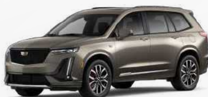
בז' מטאלי | G5D