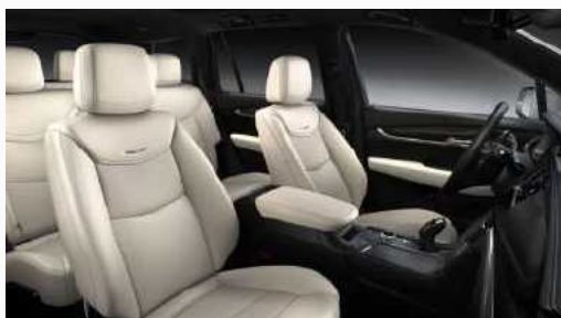
עור לבן אפרפר עם דשבורד שחור דגם SPORT