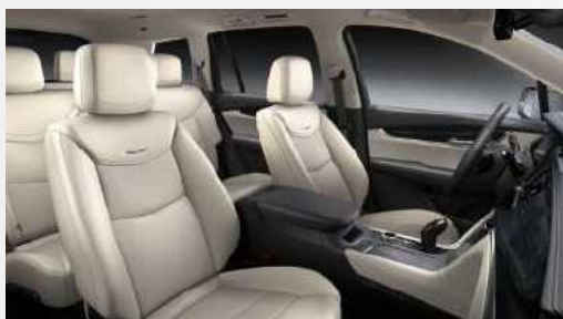
עור לבן אפרפר עם דשבורד אפור כהה דגם PREMIUM LUXURY