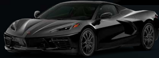
שחור - GBA