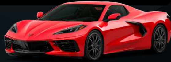
אדום - GKZ