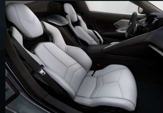
אדום מלא - HUL