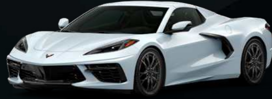
אפור קרמי - G9F