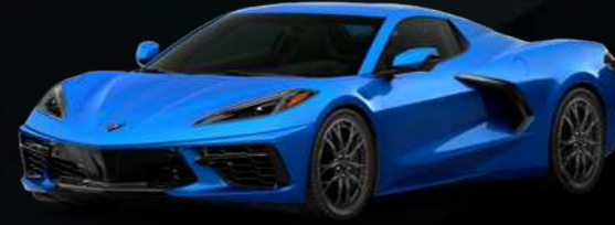
כחול אגם מטאלי - GS7