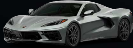
אפור על קולי מטאלי - GA7