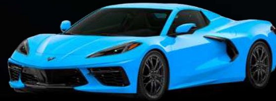
כחול ראפיד - GMO