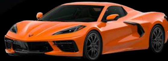
כתום מטאלי - GC5

זמינות הצבעים והריפודים הינה בכפוף למלאי. לפרטים מלאים יש לפנות אל יועצת המכירות.