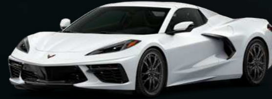
לבן ארקטי - G8G