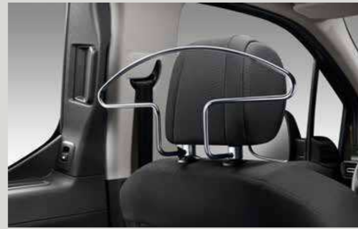
זוג קולבים למשענת ראש