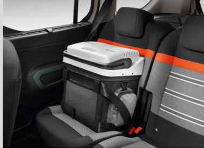
קירורית ניידת 20 ליטר, חיבור למצת הרכב 12 וולט