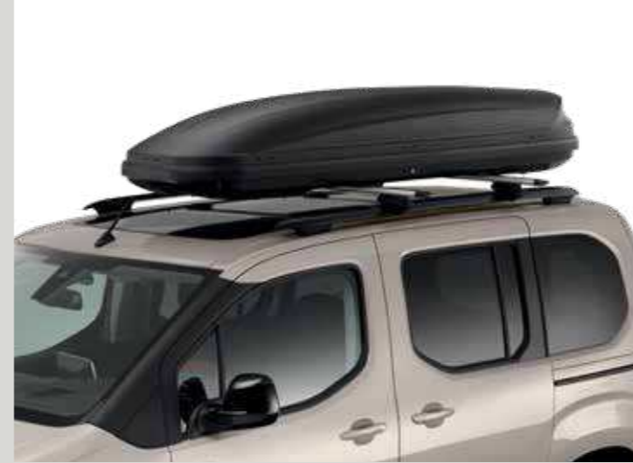
תא אחסון עילי קשיח 430 ל' THULE (נדרשים מוטות רוחב)