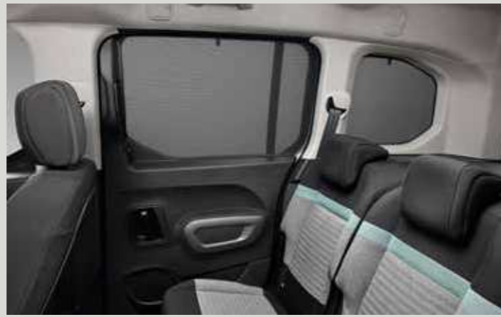
סט צלוני שמש לחלונות אחוריים (2 חלקים)