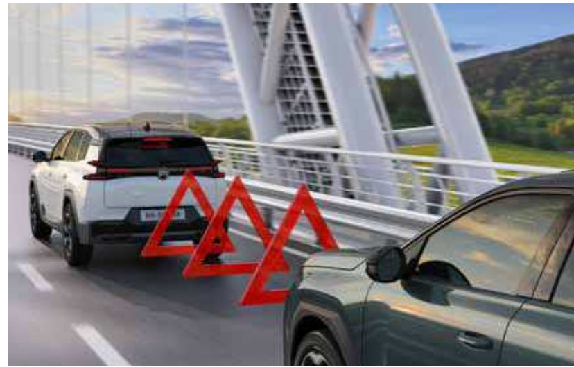
מערכת בלימת חירום אקטיבית