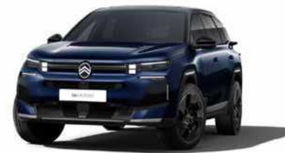
כחול כהה מטאלי – ECLIPSE DARK BLUE