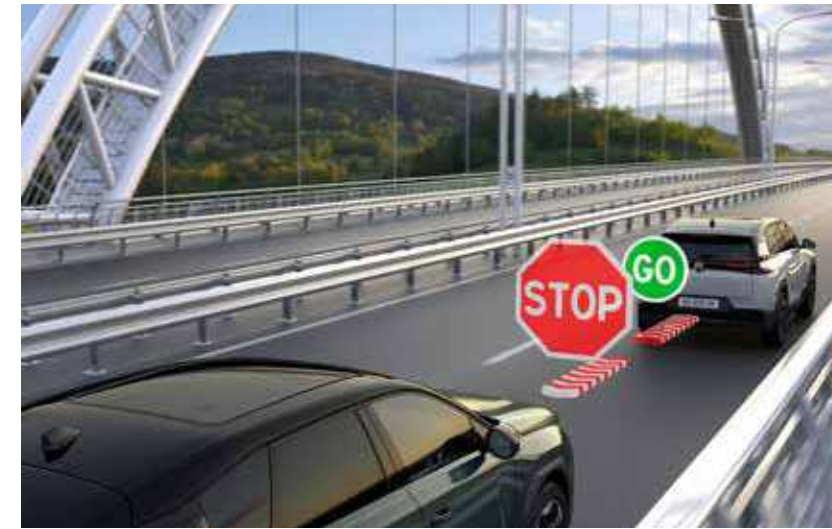
בקרת שיוט אדכטיבית עם פונקציית "עצור וסע" (STOP&GO)