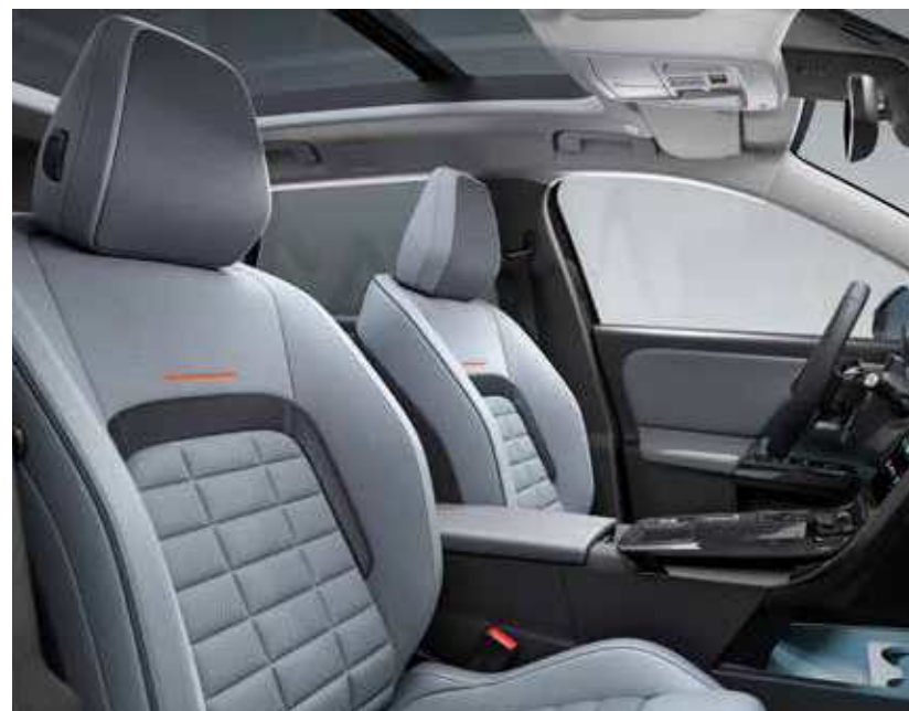
רמת גימור – MAX מושבים בריפוד משולב בד ועור מלאכותי בצבע אפור