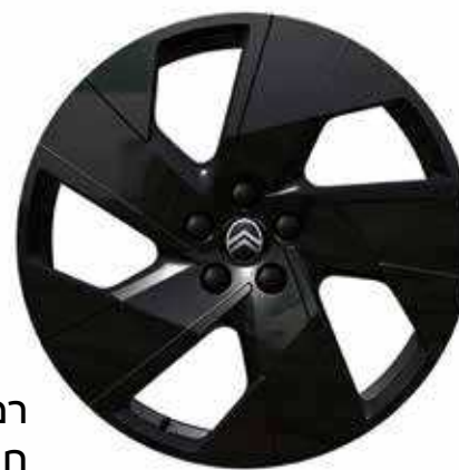
רמת גימור – MAX חישוקי 19" בגימור ZIRCON