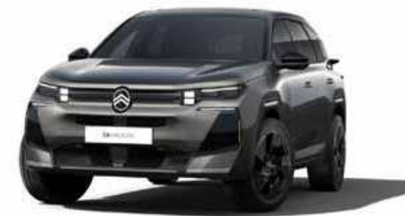
אפור כהה מטאלי – PLATINIUM GREY