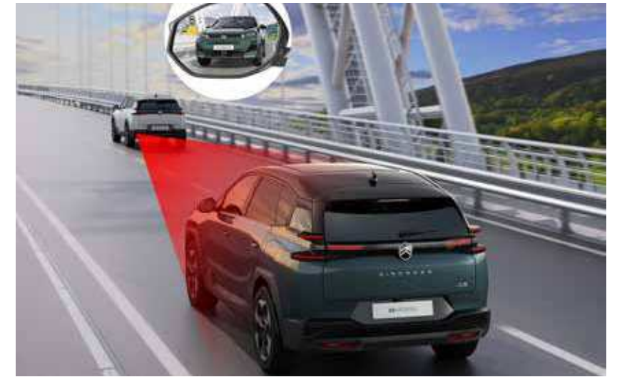
מערכת לניטור שטחים מתים*