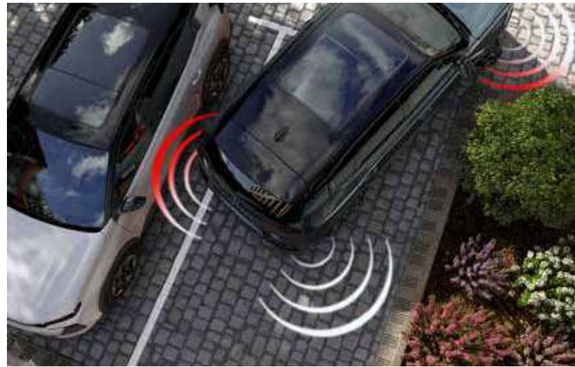
חיישני חניה היקפיים*