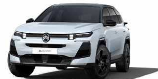
לבן מטאלי – OKENITE WHITE