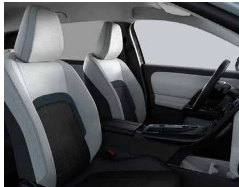
רמת גימור – YOU מושבים בריפוד בד בצבעי אפור ושחור