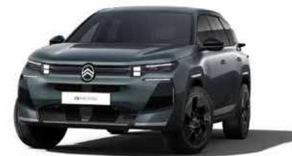
ירוק מטאלי – ASTORIA GREEN