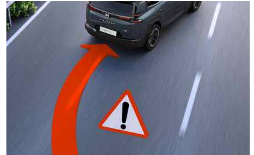
מערכת סיוע אקטיבית לשמירת נתיב ותיקוני היגוי