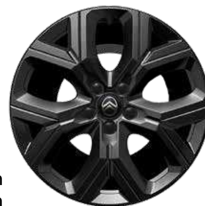
רמת גימור – YOU חישוקי 18" בגימור CARBON