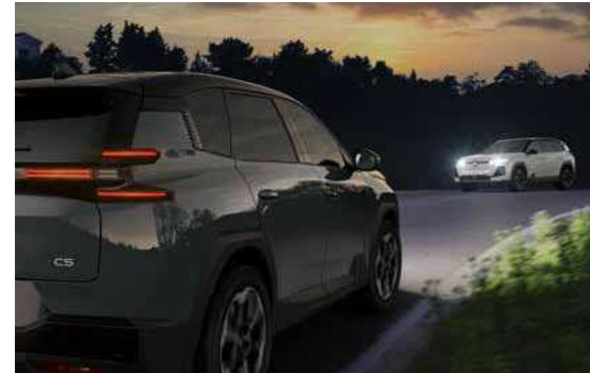
מעבר אוטומטי בין אור גבוה לאור נמוך בהתאם לתנאי הדרך