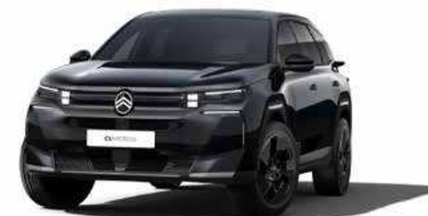
שחור מטאלי – PERLA NERA BLACK