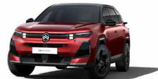
אדום מטאלי – RUBY RED