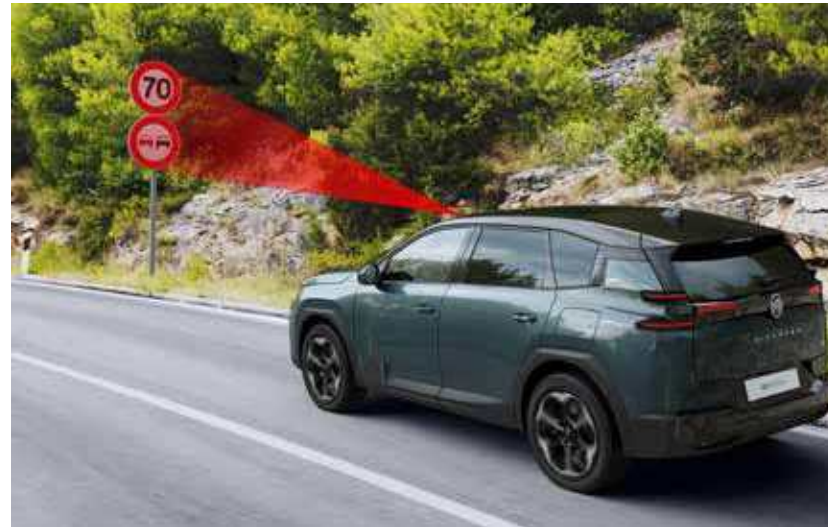
מערכת מורחבת לזיהוי תמרורים והמלצת מהירות