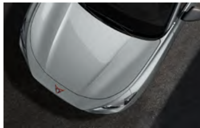
+ לבן בבאדה 2Y2Y