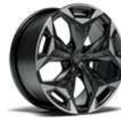
STD 19" s