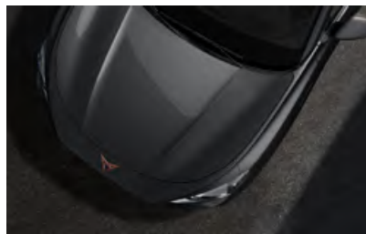
+ אפור N7N7