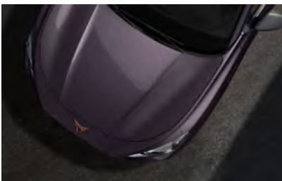
+ סגול כהה Q5Q5