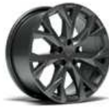
STD 18" s