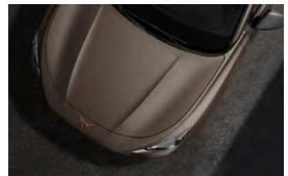
++ ברונזה מט L3L3

+ תוספת בתשלום ++ במנועי VZ בלבד בתוספת תשלום