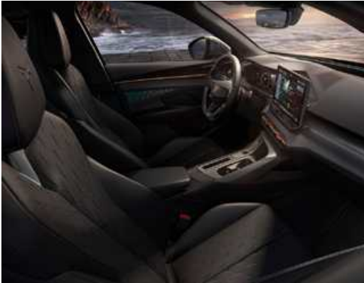
מושב באקט vz s