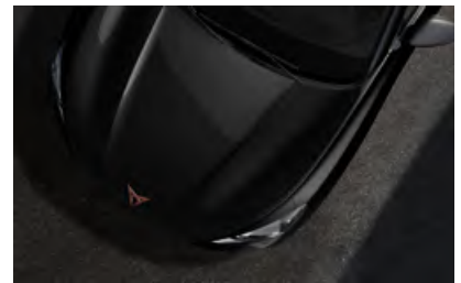
+ שחור מטאלי 0E0E