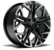
STD VZ 20" vz