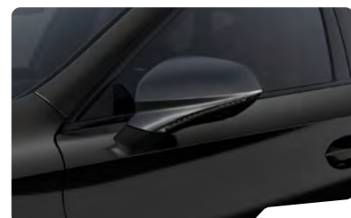
שחור מטאלי 0E0E