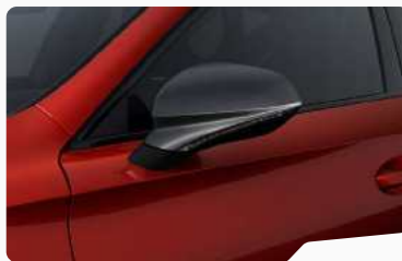
אדום כהה יין E1E1