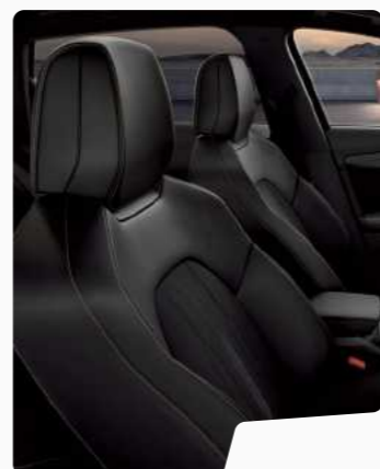
מושב ספורט ■■