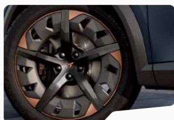
P8W 19" ■■□