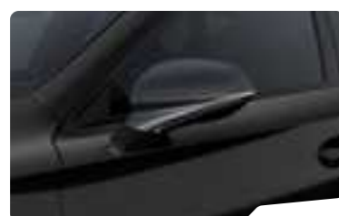
שחור מטאלי OE0E