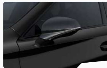
שחור מטאלי OEOE