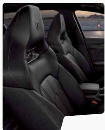
מושב באקט ■ ■■ עור שחור