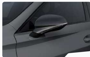
אפור גרפיט R6R6