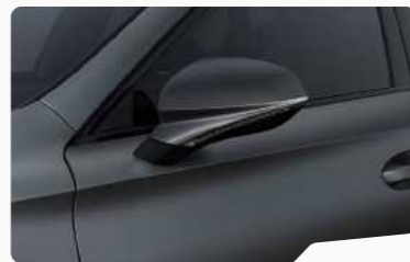
אפור מט 9R9R