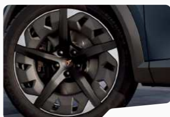
P8V 19" ■■□