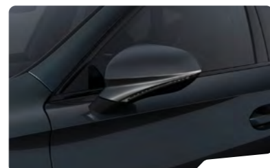
אפור מטאלי S7S7