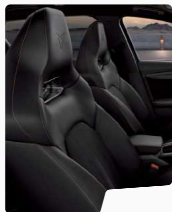
מושב באקט ■■