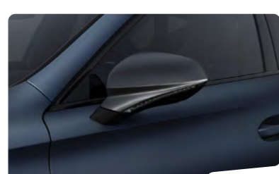
כחול מט Q4Q4