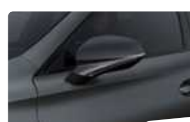
אפור מט 9R9R