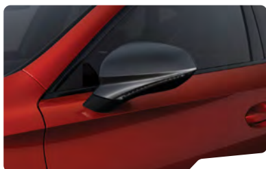
אדום כהה יין E1E1