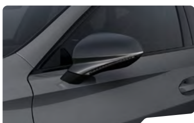
אפור גרפיט R6R6