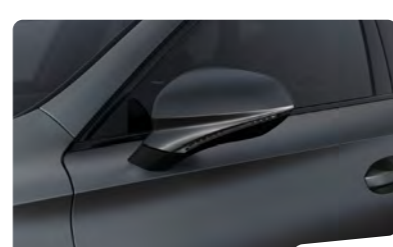
אפור מט 9R9R