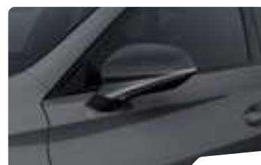
אפור גרפיט R6R6