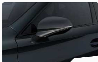
אפור מטאלי S7S7