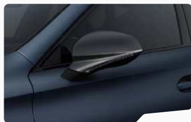
כחול מט Q4Q4