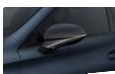
כחול מט Q4Q4