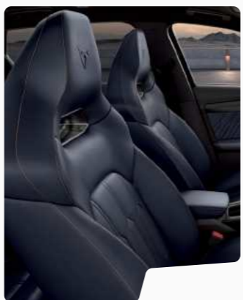
מושב באקט ■ ■■ עור כחול