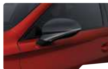
אדום כהה יין E1E1