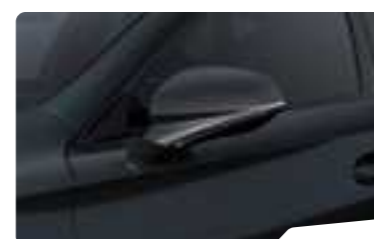
אפור מטאלי S7S7