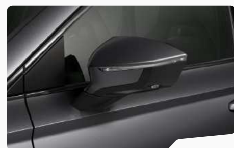
אפור גרפיט 5X5X