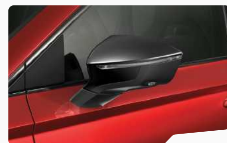
אדום מטאלי K1K1