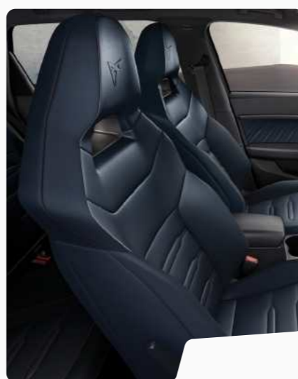
מושבי באקט עור כחוכ