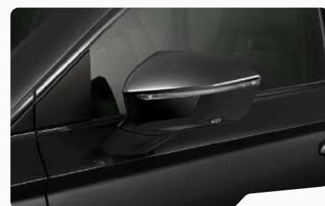
שחור מטאלי 1Z1Z