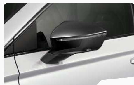
כבן נבדה 2Y2Y