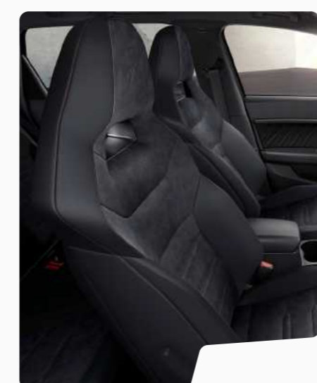
מושבי באקט אלקנטרה