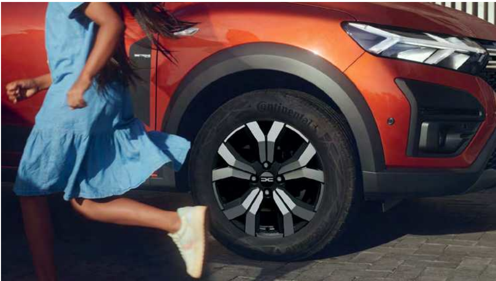
חישוקי סגסוגת חדשים

עם מרווח גחון גבוה, קשתות גלגלים מודגשות וקורות מודולריות על הגג, Jogger החדש מתאפיין בעיצוב קשוח שכובש כל דרך, והופך אותו לרכב אידיאלי למשפחות בעלות אורח חיים דינמי. הייעוד של ה-Jogger הוא להיות שותף מתמיד לחיי היומיום של משפחות המעוניינות לבלות מחוץ לעיר ובחיק הטבע. תוכלו לקחת את כל המשפחה לטיולים ואם תרצו, צרפו גם את החברים של הילדים.