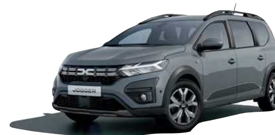
אפור אורבני מט מיוחד (KPW)