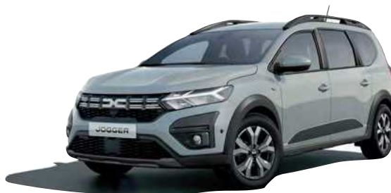
כסף מטאלי (KQF)