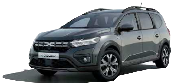
אפור מטאלי (KNA)