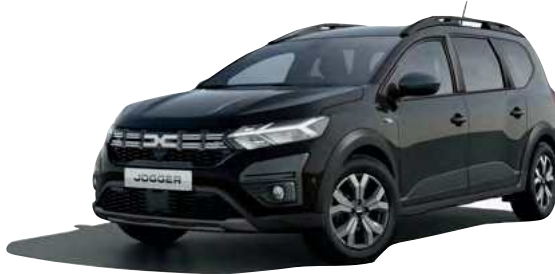
שחור פנינה מטאלי (676)