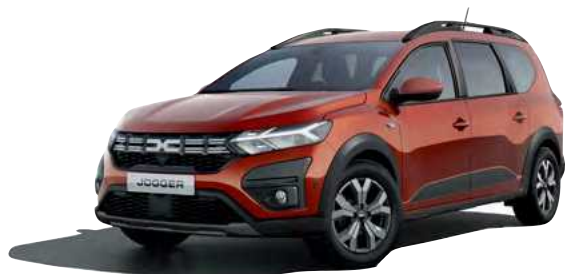
חום אדמה מטאלי (CNZ)