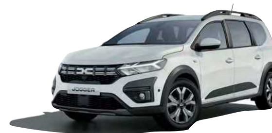
לבן קרח (369)