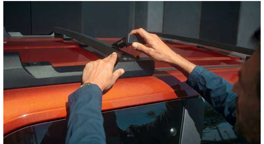
קורות גג מודולריות