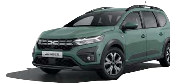
ירוק חאקי מט מיוחד (KQM)