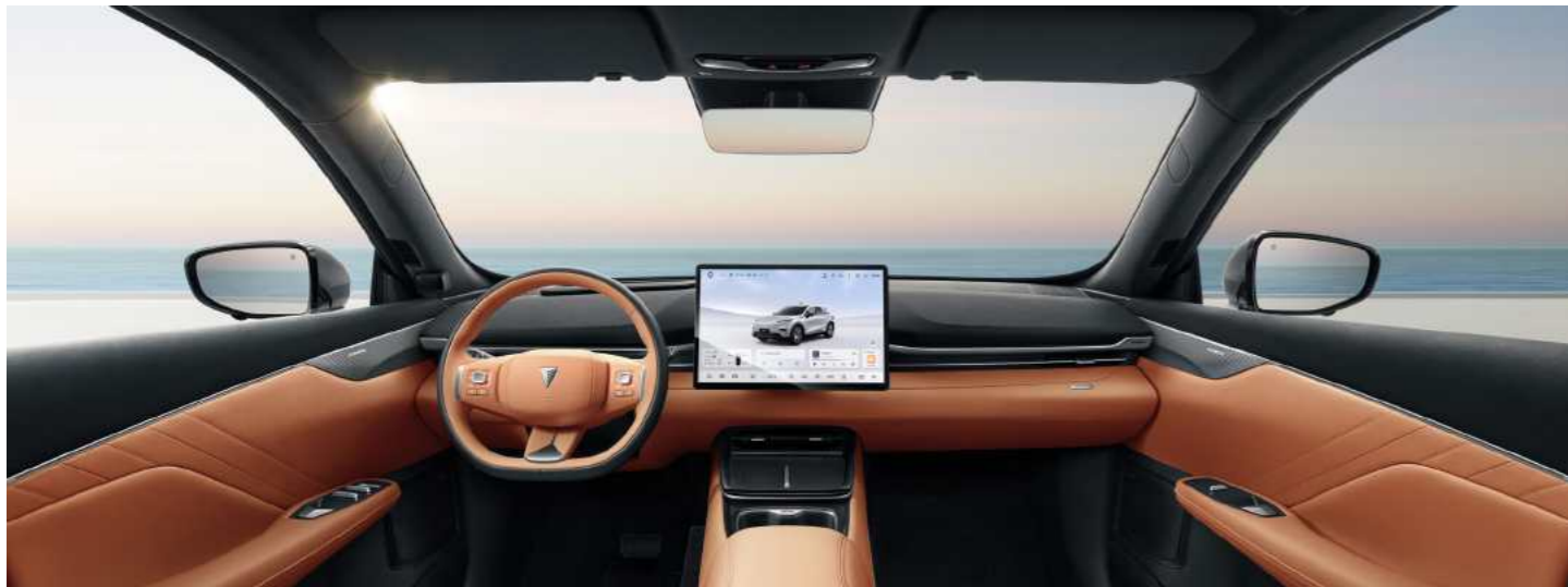
קוקפיט חכם עם מסך מסתובב 15.4" וחיווי קולי