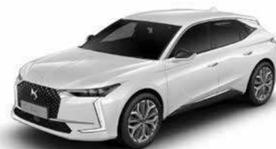
BLANC NACRE (M)