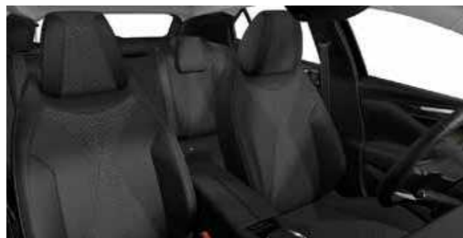
TROCADERO Tungsten Diamond Basalt Vinyl Effect