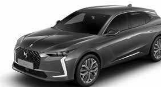
GRIS PLATINUM (M)