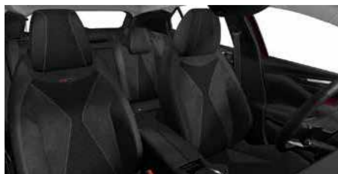
PERFORMANCE LINE Basalt Woven Alcantara