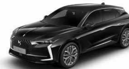
NOIR PERLA NERA (M)