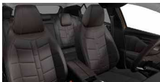
CROSS RIVOLI E-TENSE (אופציה) Criollo Brown Nappa WatchStrap Leather