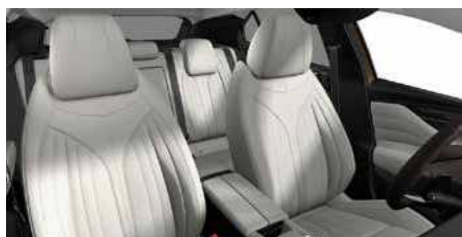
TROCADERO E-TENSE (אופציה) CROSS RIVOLI E-TENSE (אופציה) Pebble Grey Grained Leather