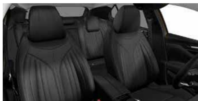
CROSS RIVOLI E-TENSE Basalt Black Grained Leather