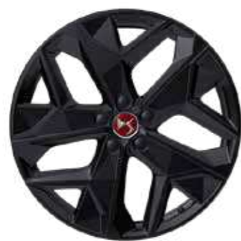
PERFORMANCE LINE MINNEAPOLIS 19"