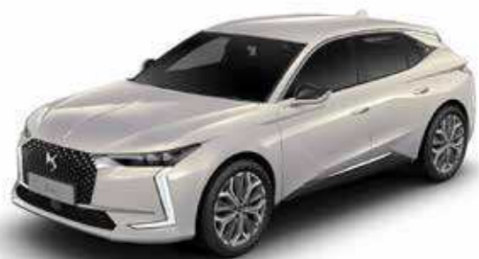
CRYSTAL PEARL (M)