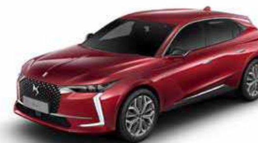
PEPERONCINO RED (M)