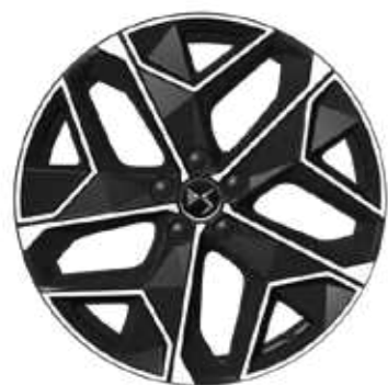
CROSS RIVOLI E-TENSE LIMA 19"