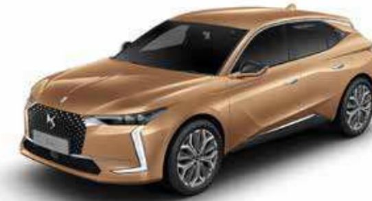
COPPER GOLD (M)