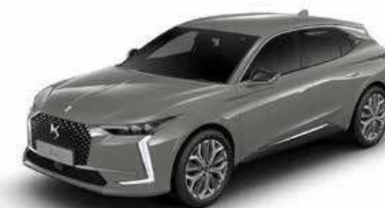
LACQUERED GREY (M)