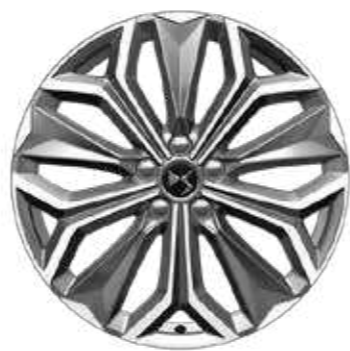
TROCADERO FIRENZE 19"