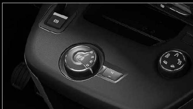
בורד הילוכים לתיבת 8 הילוכים אוטומטית