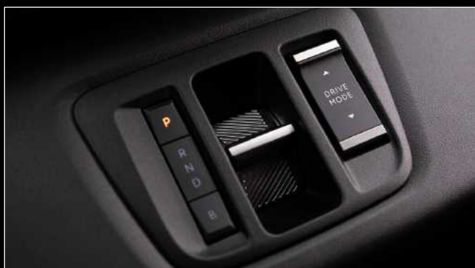
בורד הילוכים e-toggle לדגם חשמלי