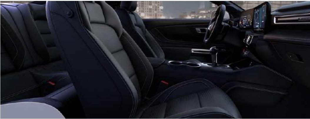
ריפוד עור בגוון שחור Black Onyx

* באמצעות טלפון נייד התומך ומאפשר זאת ובכפוף למגבלות שונות ** פועל רק עם חלק מהמכשירים הניידים