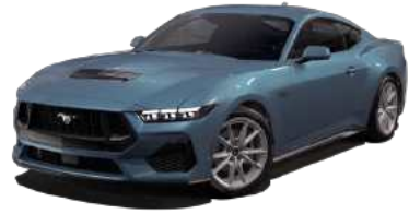
Vapor Blue (K1)