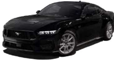
Shadow Black (G1)