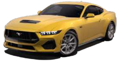
Yellow Splasht (RH)