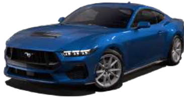
Atlas Blue (B3)