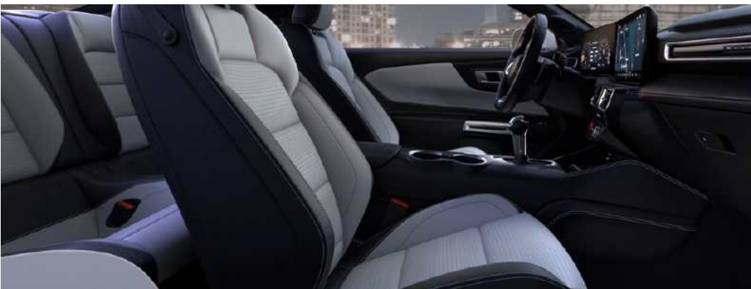
ריפוד עור בגוון אפור Space Gray