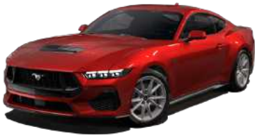
*Rapid Red (D4)