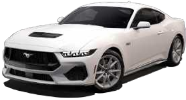
Oxford White (YZ)