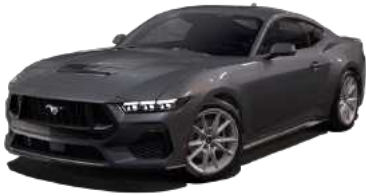
Carbonized Gray (M7)