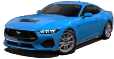
Grabber Blue (AE)