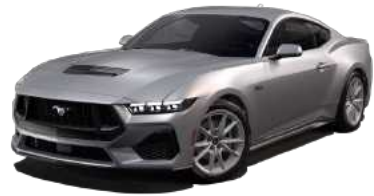
Iconic Silver (JS)