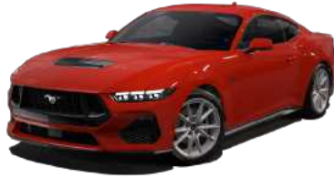
Race Red (PQ)