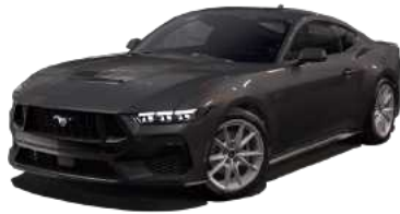
Dark Matter Gray (HY)