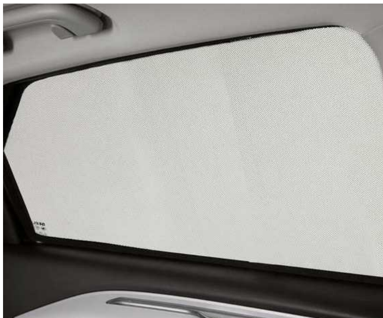
וילון הצללה מגנטי