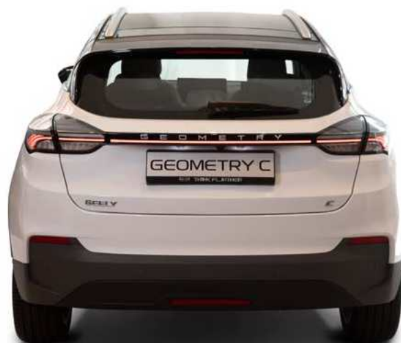
קיט תא מטען חשמלי