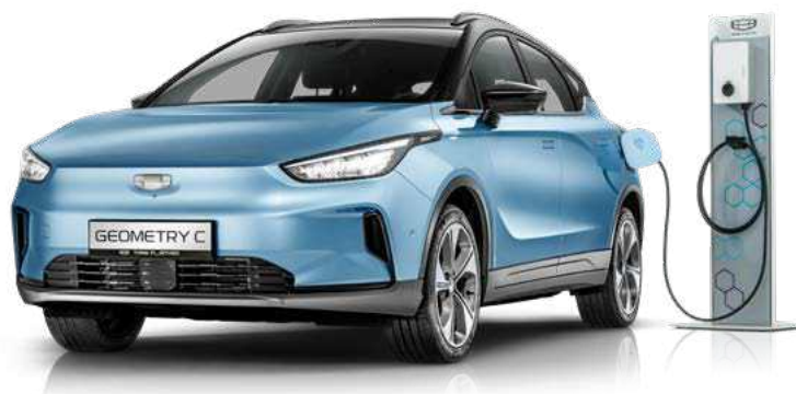
מגוון אביזרים משלימים לטעינה