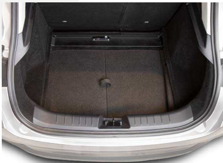
שדרוג תא המטען