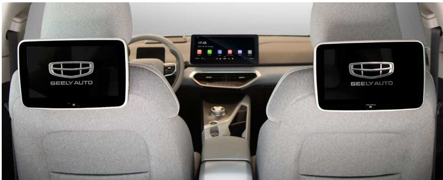
זוג מסכי ANDROID למשענות הראש