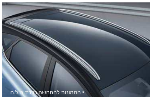
* התמונות להמחשה בלבד. ס.ל.ח.