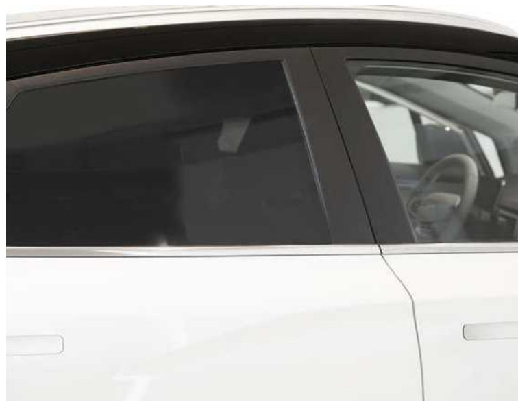
הכהית שמשות רכב