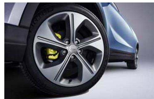
* בדגמי PRO בלבד.