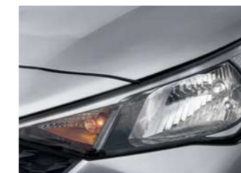
פנסי הלוגן ראשיים