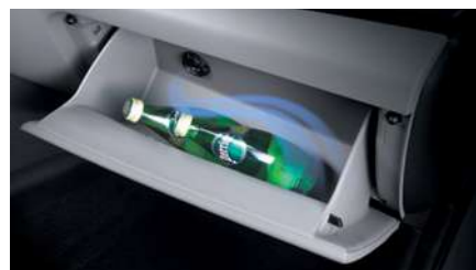
תא כפפות עם קירור