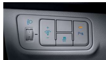
בקרת יציבות אלקטרונית