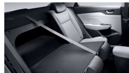
מושבים מתקפלים (ביחס 40:60)