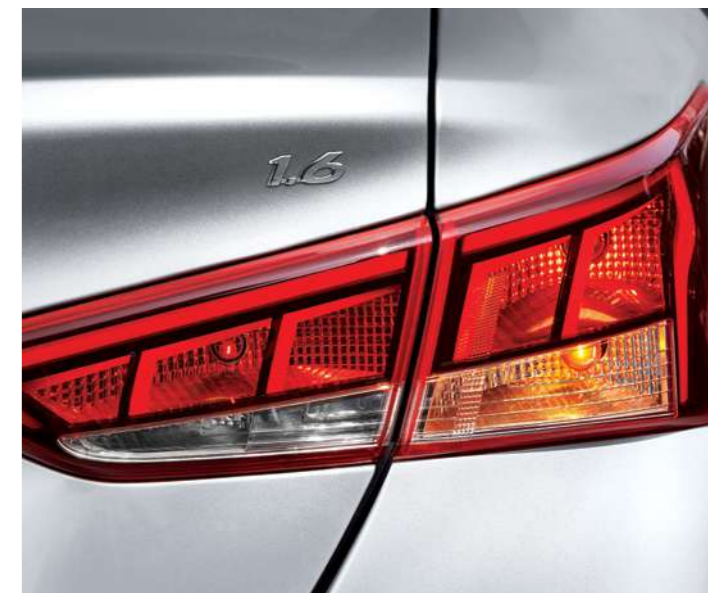
פנסים אחוריים מעוצבים