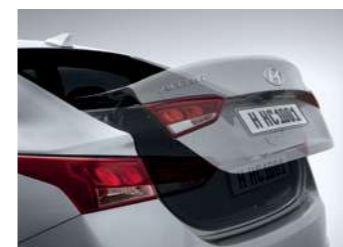
פתיחת תא מטען מהשלט