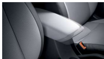
משענת יד מתכווננת