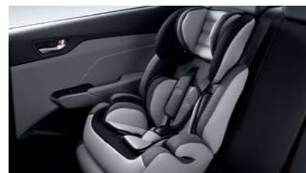
מנגנון עיגון מושב ילדים ISOFIX