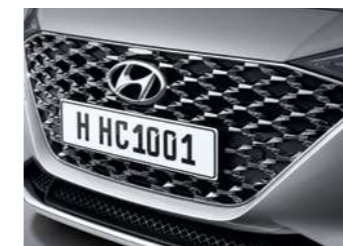
שבכה קדמית מעוצבת