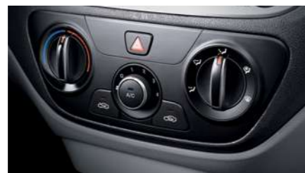
מערכת מיזוג אוויר