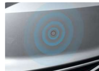
חיישני חנייה אחוריים