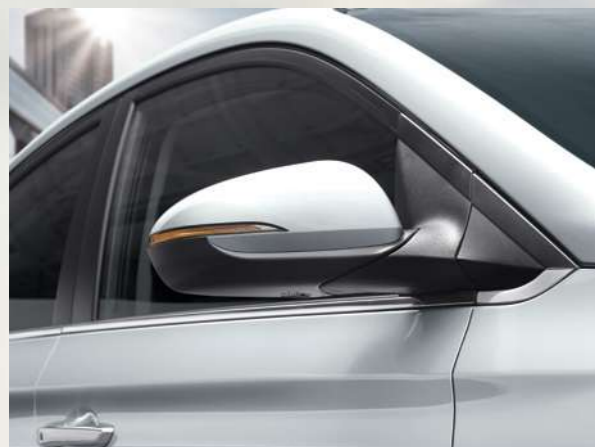
איתות במראות צד