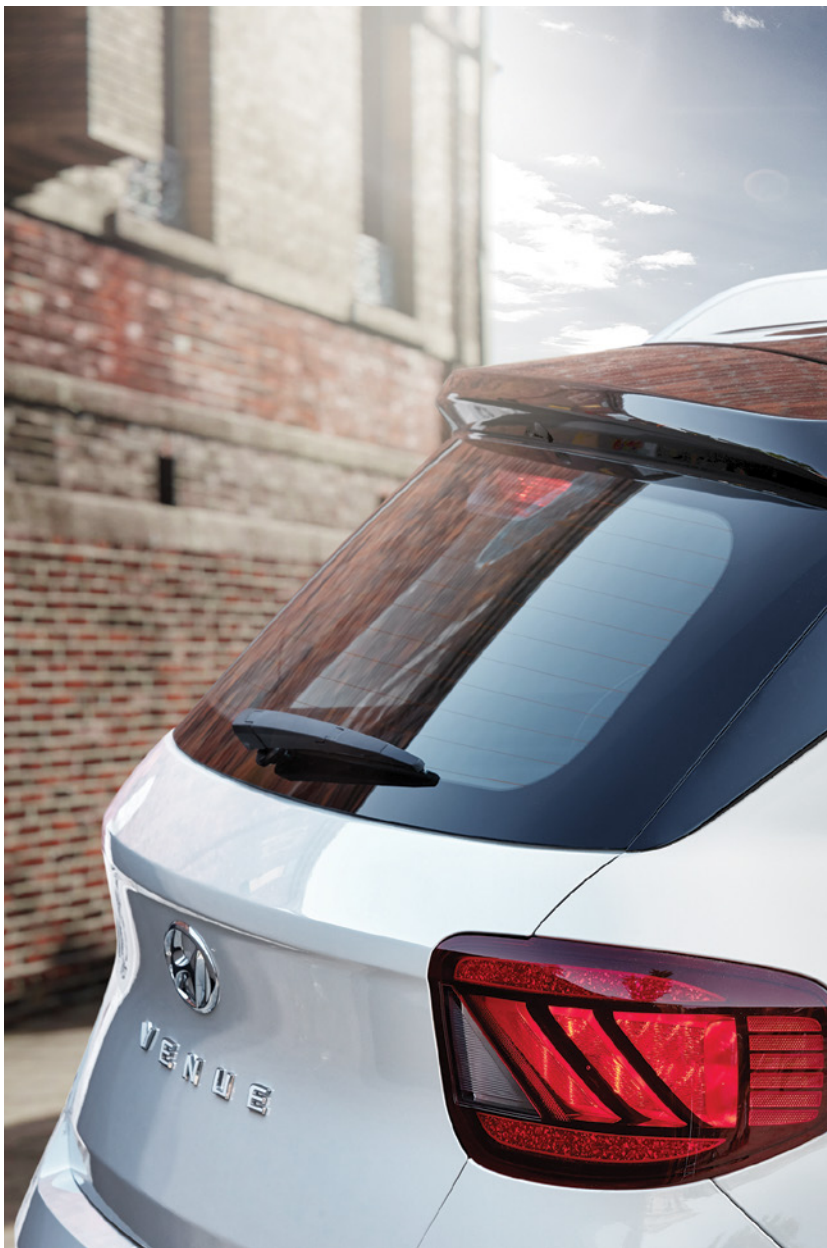
פנס אחורי בעל עדשה מעוצבת במראה אלכסוני