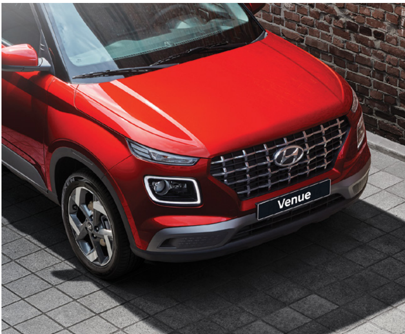
חזית במראה אגרסיבי עם גריל מעוצב*