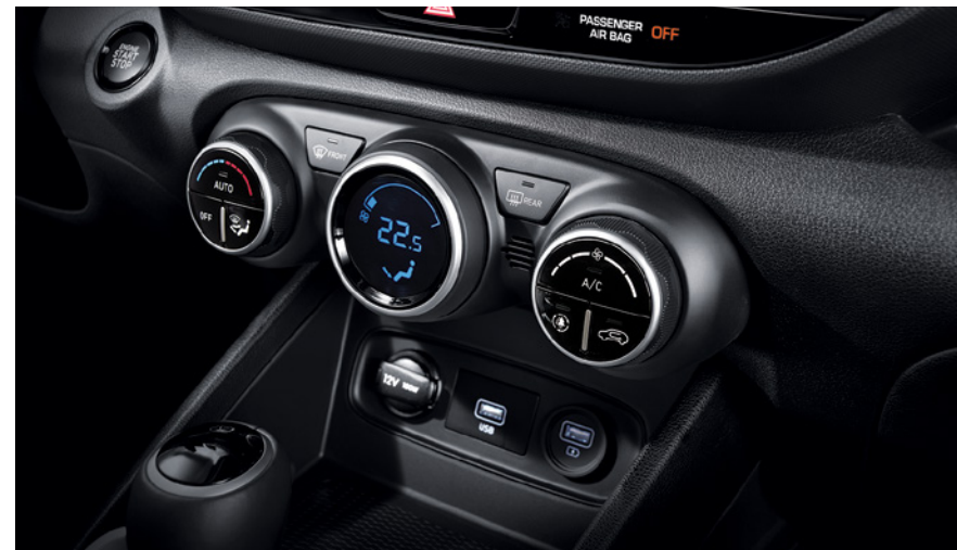
מערכת בקרת אקלים דיגיטלית**