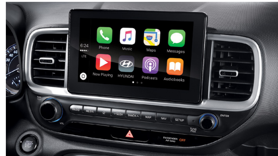
מערכת מולטימדיה מקורית 8" עם אפשרות חיבור למערכת Android Auto, Apple Carplay*