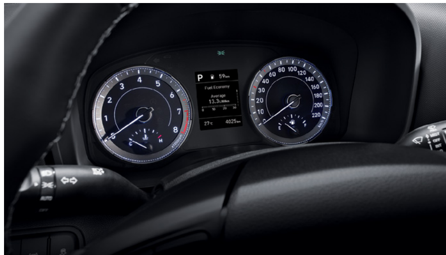
לוח מחוונים דיגיטלי "3.5