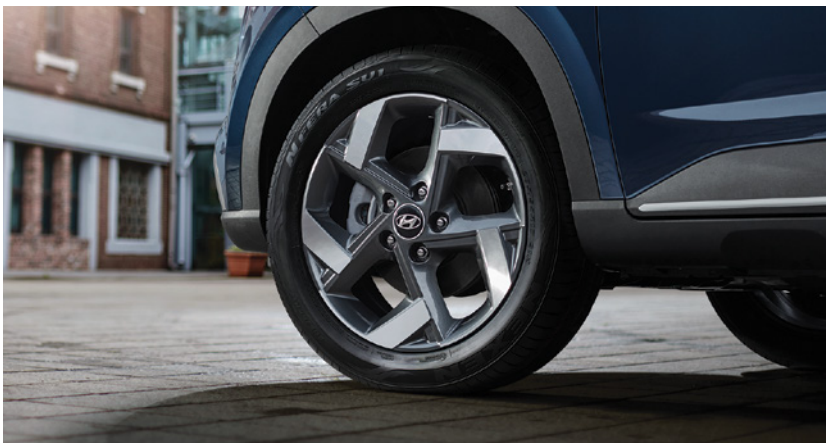
חישוקי סגסוגת "17"

יונדאי VENUE מסובב ראשים בכל פנייה. עם עיצוב חיצוני בולט הכולל גריל מעוצב עם עיטורי כרום* במראה אגרסיבי לצד פנסים מעודנים בקווים אלכסוניים.