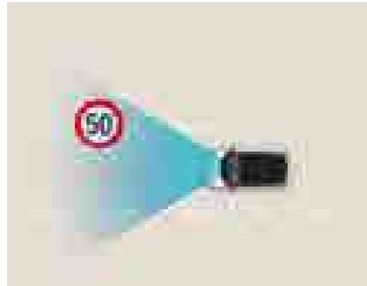
מגביל מהירות חכם כולל זיהוי תמרורי מהירות (ISLA)