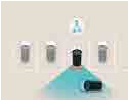
מערכת למניעת פגיעה ברכב חוצה בעת נסיעה לאחור (RCCA) מערכת המתריעה מפני רכב החוצה את מסלול הנסיעה לאחור.