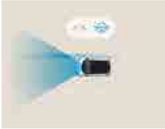
מערכת אקטיבית הכוללת תיקון הגה (LKA) מערכת בלימה אוטונומית במצבי חירום הכוללת זיהוי הולך רגל, כלי רכב, דו-גלגלי ותנועה חוצה בצומת.

ה-i20 N מצוידת במערכות הבטיחות ובמערכות העזר המתקדמות והחדישות ביותר שלנו כדי שתוכלו לנהוג בראש שקט. החל מבלימה אוטונומית בעת חירום, דרך שמירה על נתיב הנסיעה ועד זיהוי כלי רכב ב"שטח מת" – ה-i20 N יכולה להזהיר אתכם מפני סכנות אפשריות הנמצאות סביבכם במהלך הנהיגה.