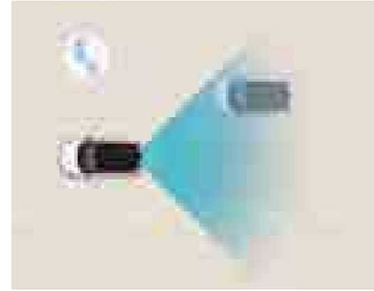
מערכת לזיהוי ומניעת התנגשות בכלי רכב ב"שטח מת" (BCA) מערכת למניעת התנגשות בעת מעבר נתיב המספקת התרעה על רכב ב"שטח מת".