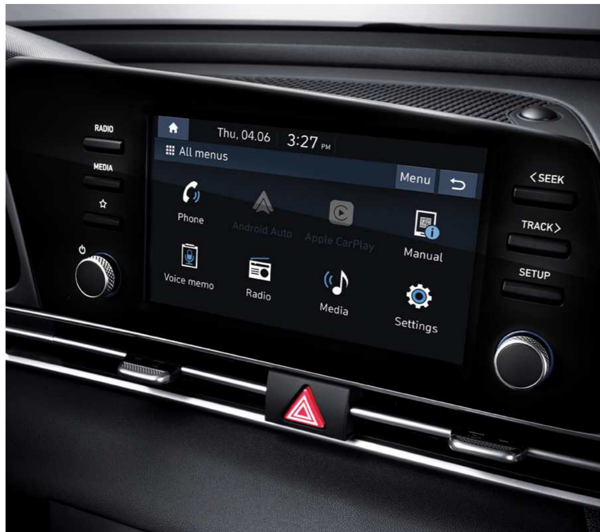
מערכת מולטימדיה מקורית 8" מתקדמת עם אפשרות חיבור Apple CarPlay ו-Android Auto*