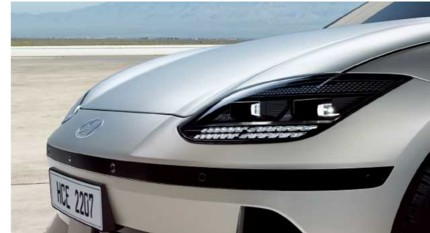
פנסים קדמיים מסוג LED בעיצוב פיקסלים