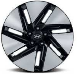
חישוקי סגסוגת בקוטר 18"