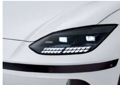
תאורת מטריקס LED קדמית מלאה*