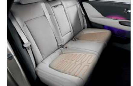
חימום מושבים אחוריים*