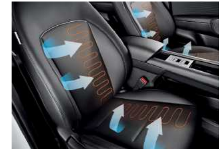
חימום מושבים קדמיים