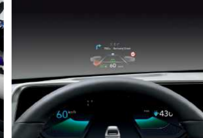
תצוגה עילית על גבי השמשה (HUD)*