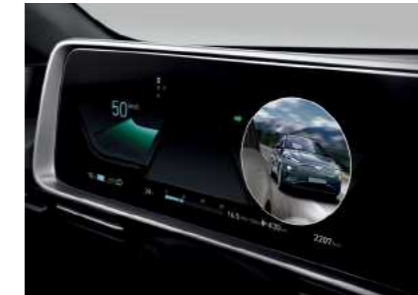
הצגת צילום חי של "שטח מת" על גבי לוח המחוונים הדיגיטלי בעת הפעלת איתות (BVM)*