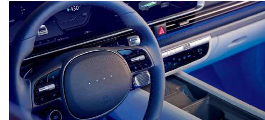
תאורת LED משתנה*

תאורה אינטראקטיבית על גלגל ההגה הכוללת 4 נורות LED המציגה את חיווי הטעינה של הסוללה ומצבי הנהיגה השונים.