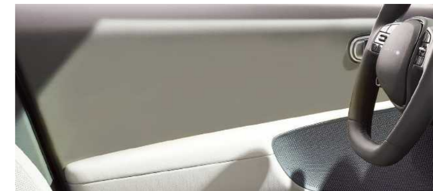
דלת חלקה ללא כפתורים

הכפתורים עברו מהדלתות הקדמיות אל הקונסולה המרכזית כדי להגדיל את החלל ואת מקום האחסון.