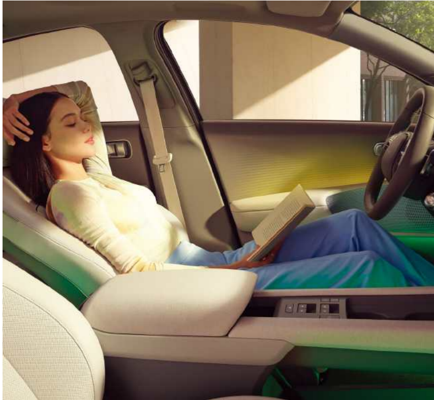
מושבים קדמיים מתכווננים הניתנים להטיה מלאה (Relaxation Comfort Seat)**

גלו את המגוון הרחב של מאפייני הנוחות ב-IQ6.