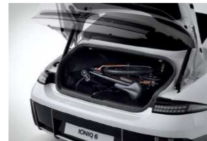
דלת תא מטען חשמלית