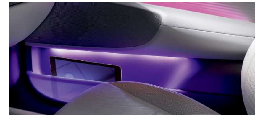
תאי אחסון שקופים בדלתות