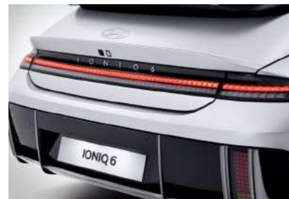
פנסים אחוריים בתאורת LED