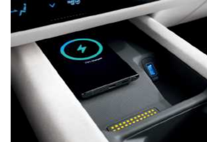
טעינה אלחוטית לנייד (למכשירים תומכים בטכנולוגיה לפי תקן טעינה (qi)