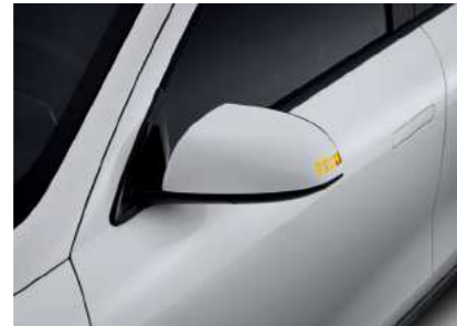
איתות במראות צד