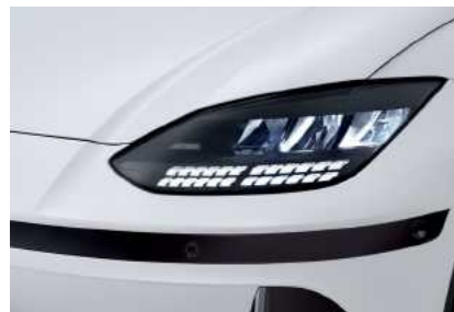
פנסים ראשיים + תאורת יום LED