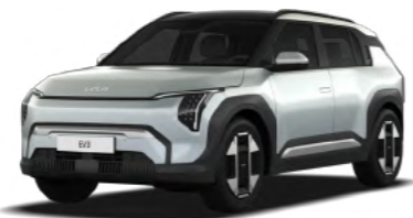
כסף מט (ISM)