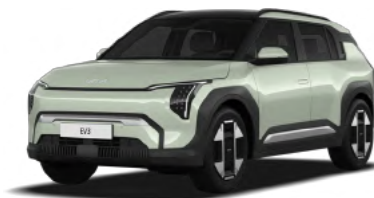
ירוק בהיר (AG3)