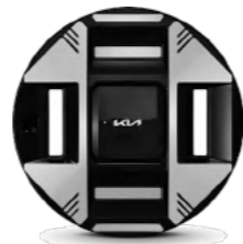
חישוק 19 אינץ'