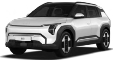
לבן פנינה (SWP)