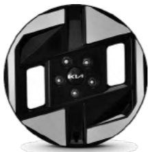
חישוק 17 אינץ'