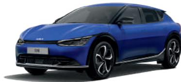
Yacht Blue (DU3)