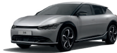
Moonscape (KLM)* צבע בתוספת תשלום*