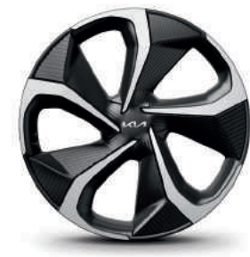
חישוקי סנסוגת 20 אינץ' (GT-line)