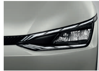
פנסים ראשיים MFR LED (בדגם Premium)