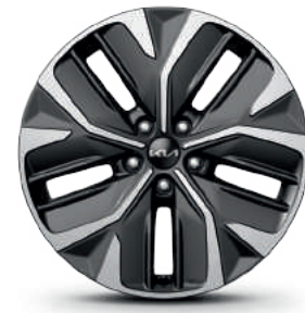
חישוקי סנסוגת 19 אינץ' (Premium)