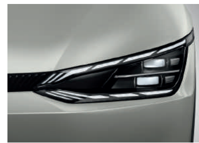
פנסים ראשיים IFS LED (בדגם GT-Line)