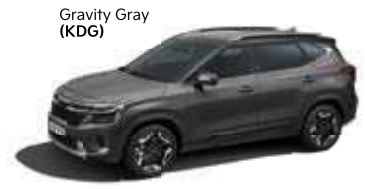
Gravity Gray (KDG)