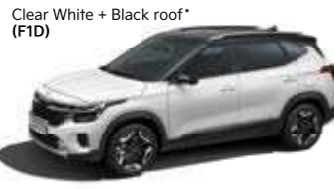
Clear White + Black roof* (F1D)