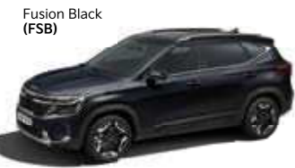
Fusion Black (FSB)