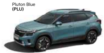
Pluton Blue (PLU)