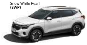
Snow White Pearl (SWP)