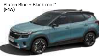
Pluton Blue + Black roof* (F1A)