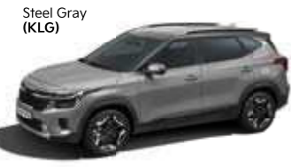
Steel Gray (KLG)