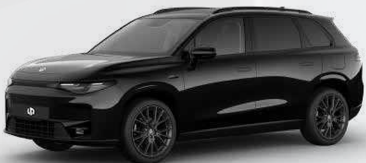
● שחור מטאלי