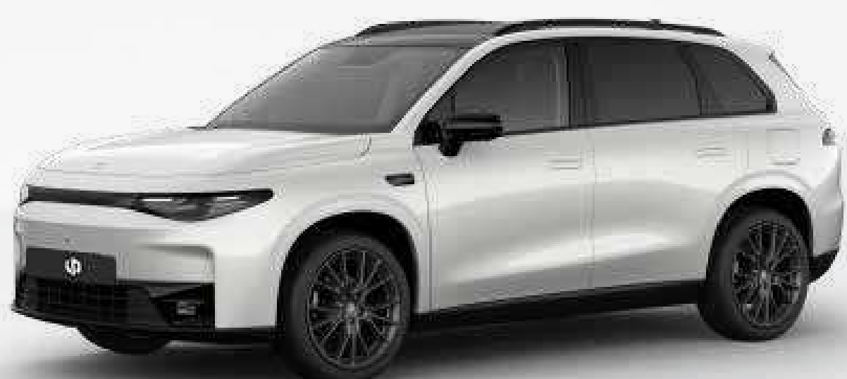
● לבן פנינה