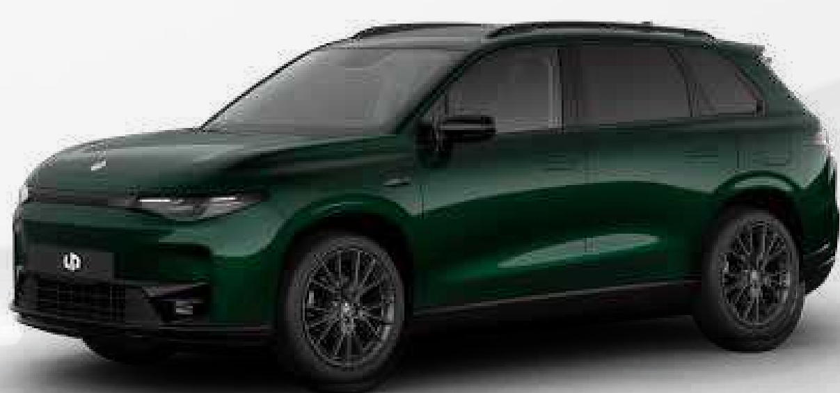
● ירוק מטאלי