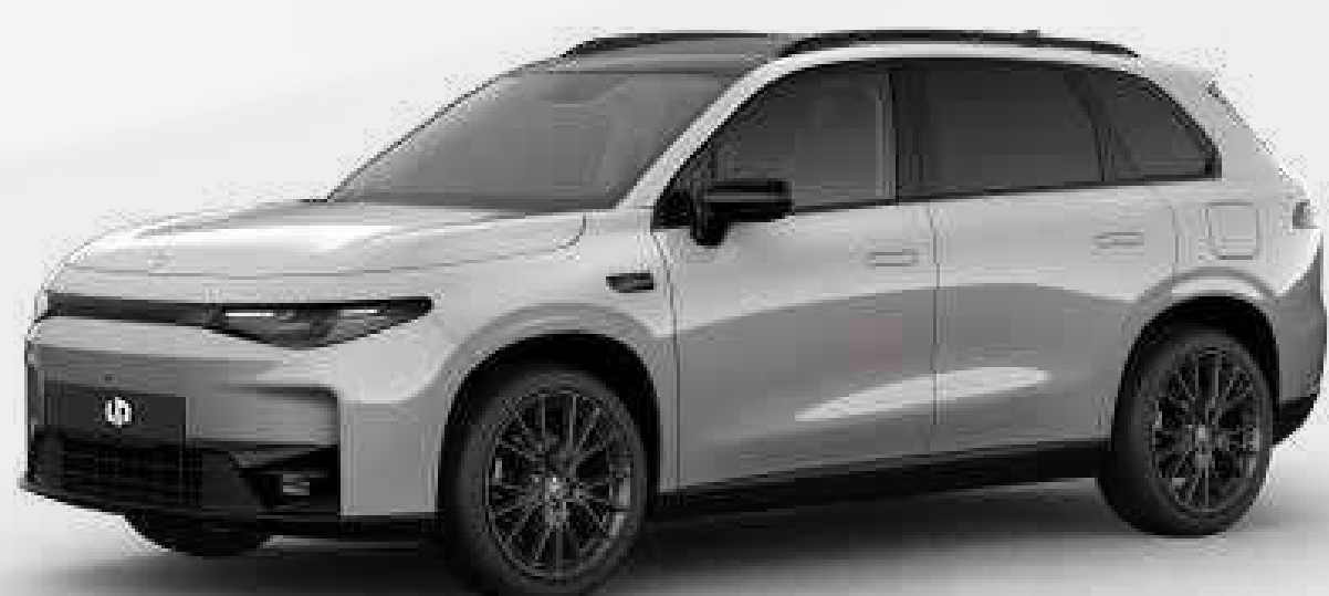
● אפור בטון