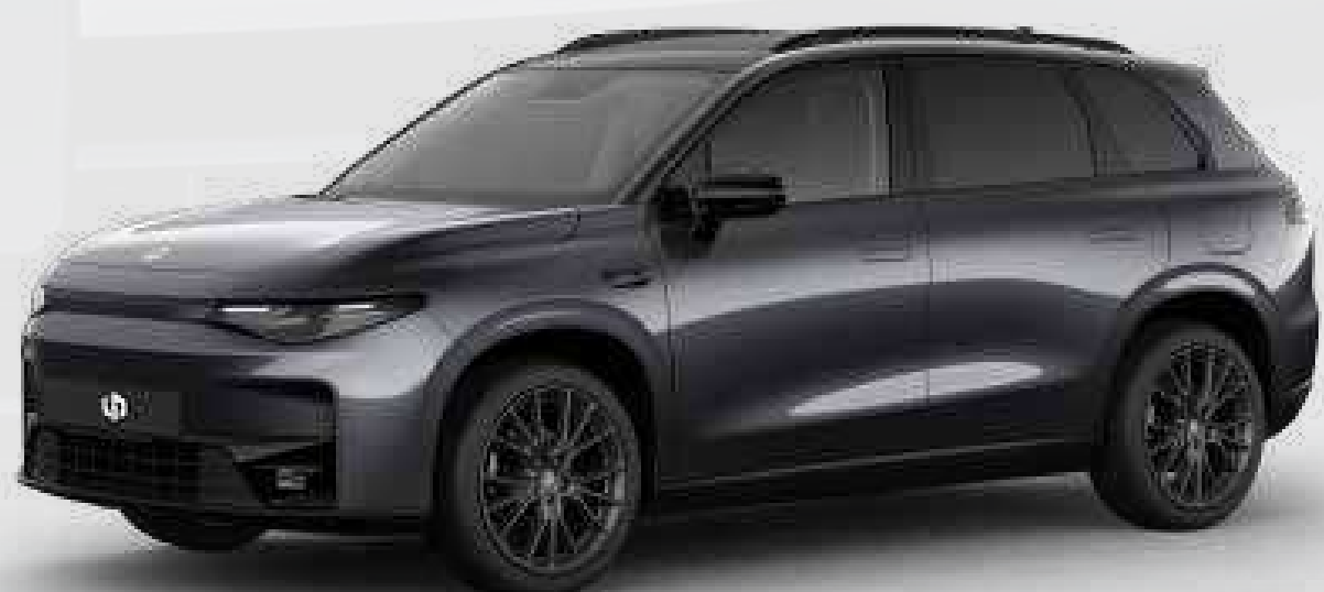
● אפור מטאלי