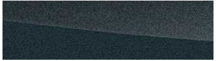
SONIC GREY | 1L1