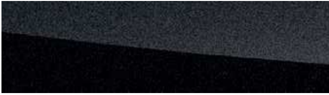
GRAPHITE BLACK | 223