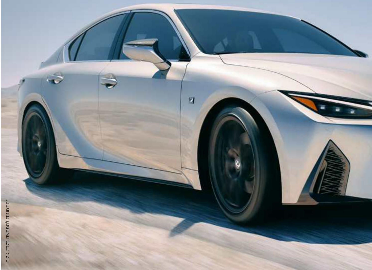
*התמונות להמחשה בלבד. סלח.