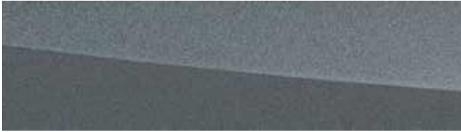
SONIC PLATINUM | 1L2