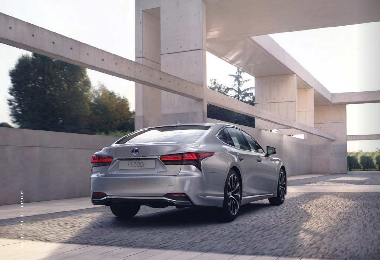
*התמונות להמחשה בלבד. טל. 07-700-7000