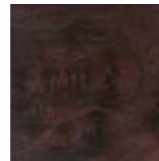
Open Pore Walnut