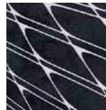
Laser Cut Special Open Pore Ash