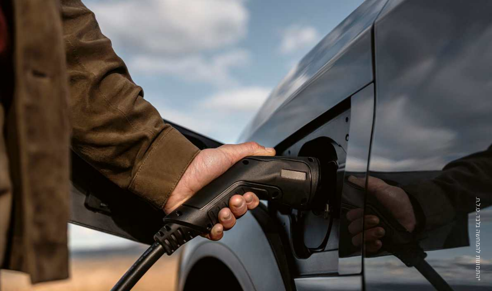
*התמונות להמחשה בלבד. ט"ל ח.