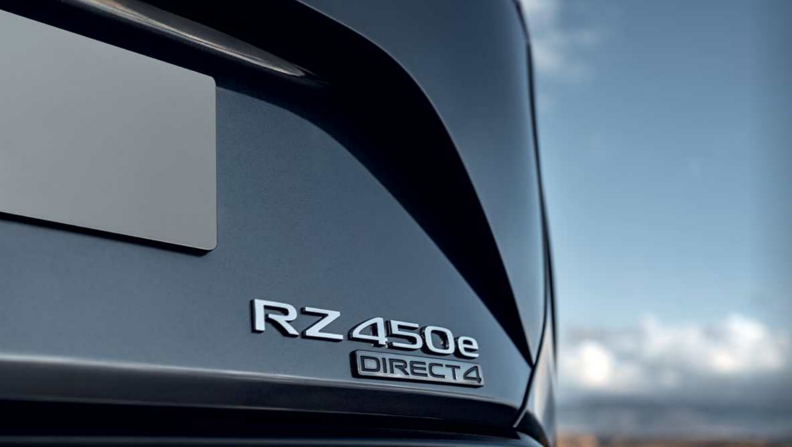
צבעים | צבעי חוץ