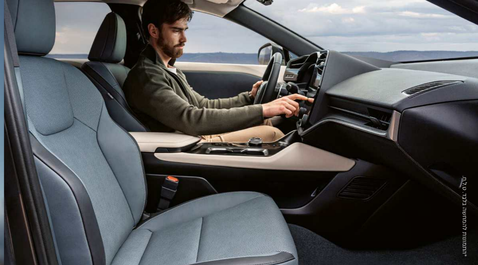
צבעים | צבעי פנים