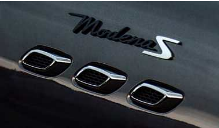
לבנטה - פתחי אוויר צידיים וסמל Modena

בהתאם למסורת הגראן טוריסמו של מזראטי, הלבנטה מציעה את כל מה שהייתם מצפים ממזראטי - מהיענות נושכת ועד לעידון נטול מאמץ בנסיעות למרחקים ארוכים. במקביל, פרופורציות ה-SUV הדרמטיות שלה מאזנות על ידי קווים מלאי חן וצורות שריריות המשדרות את ייעודה הדינמי. מהשלדה עם מרכז הכובד הנמוך מאוד המאפשרת לכם לשייט במהירויות גבוהות, דרך חלוקת המשקל המאזנת לחלוטין, ועד למרכב האווירודינמי החד שלה. השילוב האולטימטיבי של ביצועים מובילים בכביש ויכולות שטח.