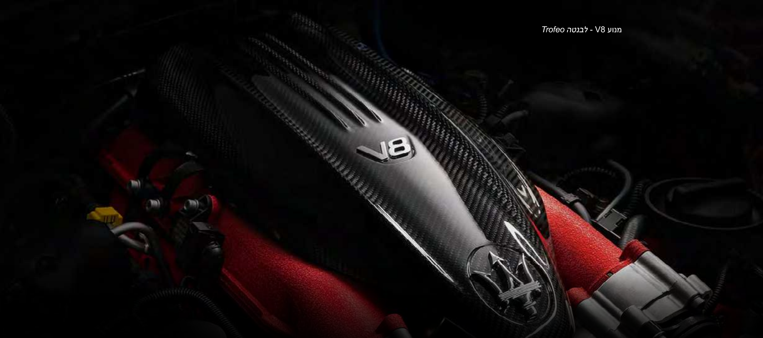
מנוע V8 - לבנטה Trofeo

המנועים בגרסאות השונות של הלבנטה מציעים את כל מה שהייתם מצפים ממזראטי - מהיענות נושכת ועד לעידון נטול מאמץ בנסיעות למרחקים ארוכים. הם גם יעילים להפליא.