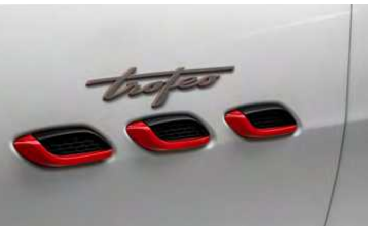
פתחי אוויר צדיים וסמל Trofeo - Levante Trofeo