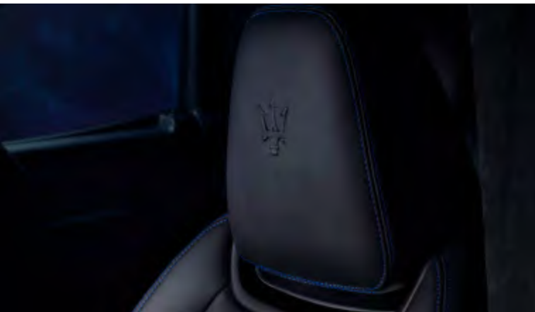
לבנטה GT Hybrid - פרט במשענת הראש