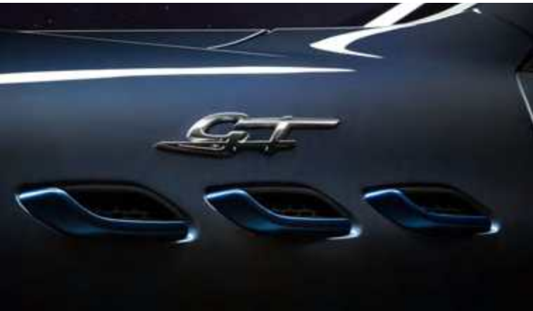
לבנטה GT Hybrid - פתחי אוויר צידיים וסמל GT