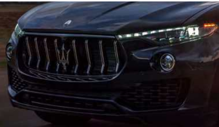
לבנטה GT Hybrid - גריל

הלבנטה GT Hybrid היא המזראטי של דגמי ה-SUV שמביאה את הביצועים והסגנון לגבהים חדשים, עם יעילות וחיסכון משופרים. מעוררת השראה, מחשמלת, עם השאגה האופיינית של מזראטי. הטכנולוגיה ההיברידית של הלבנטה החדשה מתוכננת להגביר את הריגוש של כל הרפתקה שאתם יוצאים אליה. אל תסכימו לקבל גבולות, פרצו את הדרך עם ביצועים נפלאים של מזראטי שתמיד לוקחים אותכם רחוק יותר. הלבנטה GT Hybrid מאיצה ב-0.9 שניות מהר יותר מגרסת הדיזל של הלבנטה, ומגיעה מ-0 ל-100 קמ"ש בתוך 6 שניות, ולמהירות מרבית של 240 קמ"ש. השם הוא אמנם טכנולוגיה היברידית חלקית (Mild Hybrid), אבל בחיים היא עוצמה שואגת של מזראטי. המערכת ההיברידית צורכת 18% פחות דלק אך משיגה ביצועים זהים לאלה של גרסת הבנזין V6 עם 350 כ"ס.