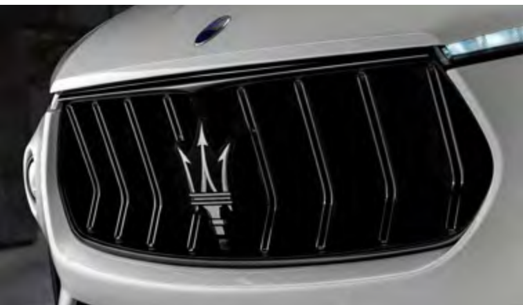
גריל - Levante Trofeo