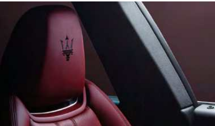
לבנטה - עיצוב משענת הראש