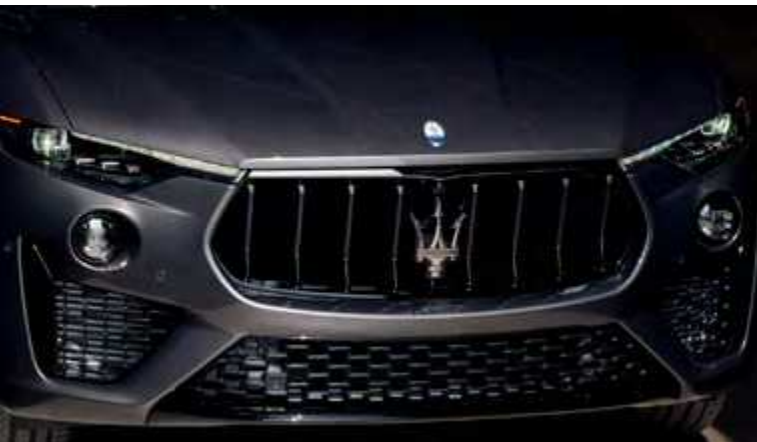
לבנטה - גריל