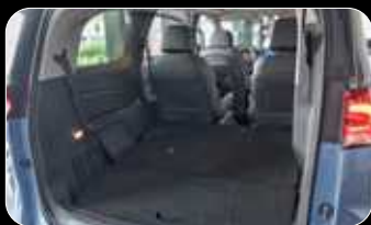
נפח תא מטען מקסימלי (שורה 3 מקופלות)