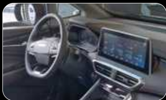
ידית הילוכים צמודה להגה