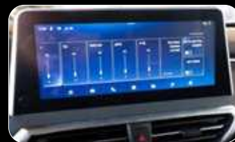
תצוגת מערכת מולטי מדיה בעברית