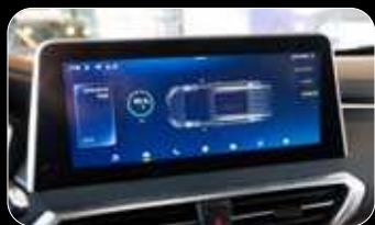
תצוגת אחוז סוללה