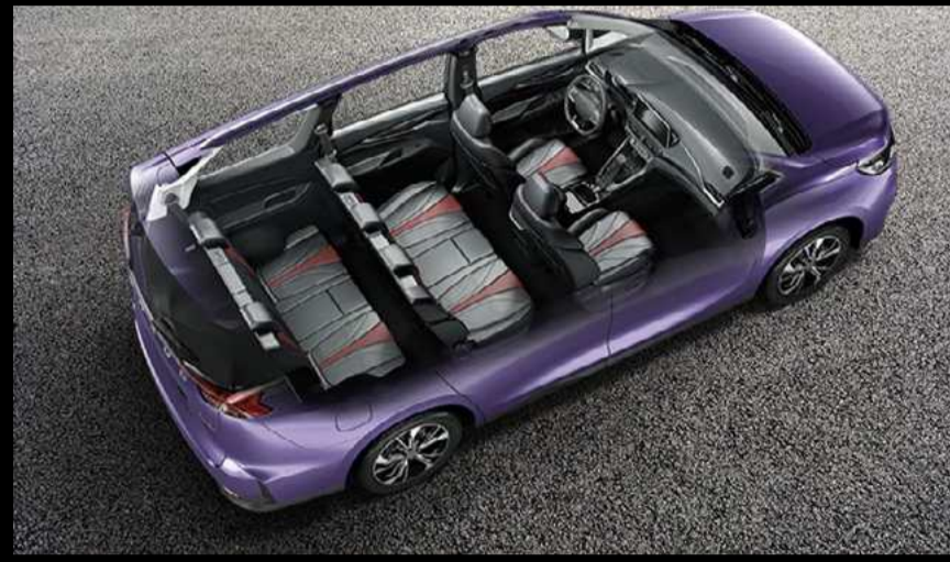
בעלת 7 מקומות נוחה ומרווחת