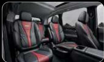
שורת כסאות שניה מושבי "קפטן" נפרדים ומרווחים