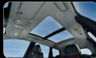
גג פנורמי נפתח