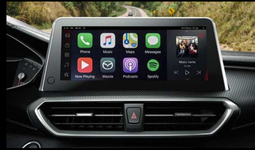
מסך מולטימדיה ענק נוח לשימוש, הכולל שלל חבנים מתקרמים