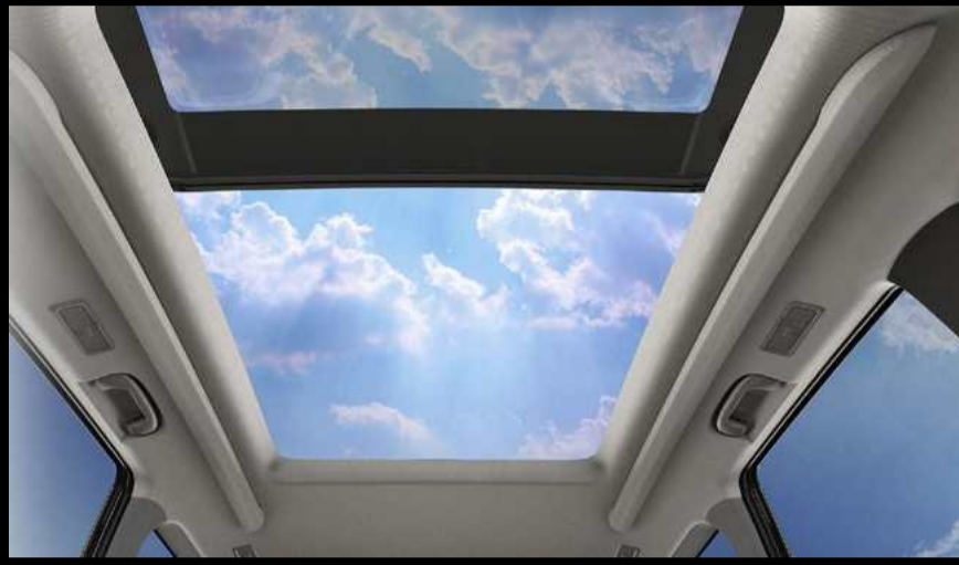
גג סונרמי הנתון החושה של מרחב פנימי גדול יותר