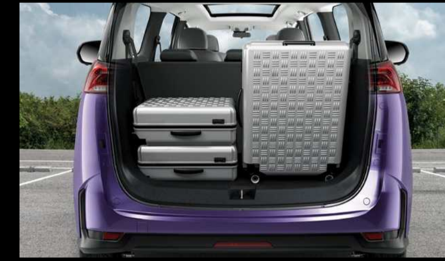
העמסת מטען ב-EUINO5 היא משימה קלה מאי פעם, הודות לפתיחה חשמלית לדלת תאי המטען