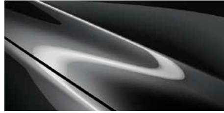
אפור עשיר (46G)*