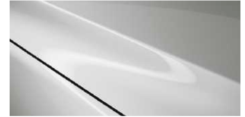
לבן פנינה (25D)

* צבע בתוספת תשלום לתשומת ליבך! דוגמאות הצבעים, הריפודים והחישוקים בעלון זה מוצגות לשם המחשה בלבד. בשל מגבלות הדפוס, תכונה סטיות מהצבעים והחומרים בפועל. היצע הצבעים כפוף לשינויים אפשריים על פי מדיניות היצרן ולמגבלות המלאי. פנה לנציג מכירות לקבלת מידע עדכני.