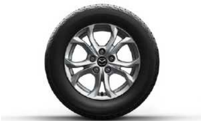
חישוקי סגסוגת 16"