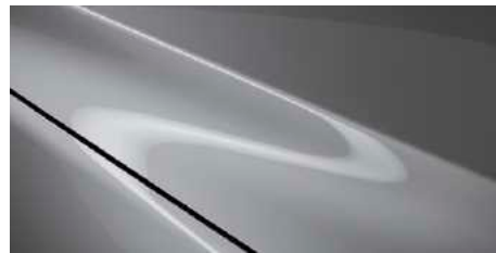
אפור בטון (52C)