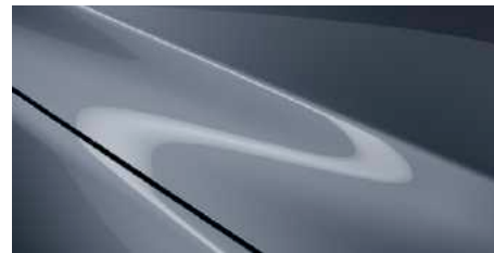
כחול מתכתי (47C)