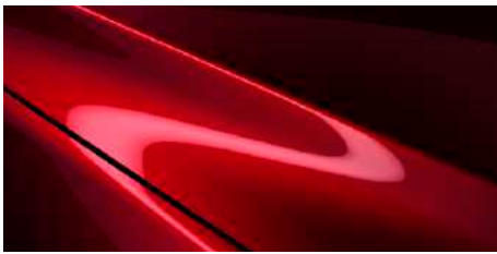
אדום עשיר נוצץ (46V)*