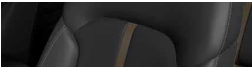
ריפודי עור Nappa בגוון שחור