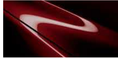
Artisan Red (51F)*

* צבע בתוספת תשלום לתשומת ליבך! דוגמאות הצבעים, הריפודים והחישוקים בעלון זה מוצגות לשם המחשה בלבד. בשל מגבלות הדפוס, תתכנה סטיות מהצבעים והחומרים בפועל. היצע הצבעים כפוף לשינויים אפשריים על פי מדיניות היצרן ולמגבלות המלאי. פנה לנציג מכירות לקבלת מידע עדכני.