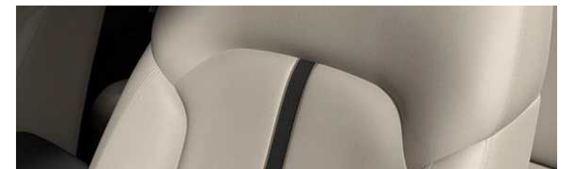
ריפוד Leatherette בגוון בז'