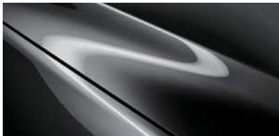
Machine Gray (46G)*