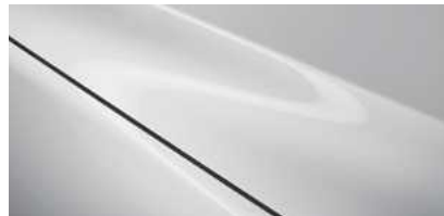
Rhodium White (51K)*