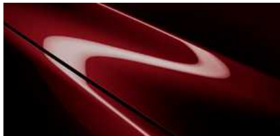
Artisan Red (51F)*