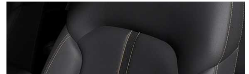
ריפוד Leatherette בגוון שחור