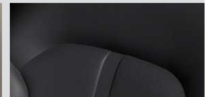
עור בגוון שחור