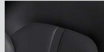
עור בגוון שחור