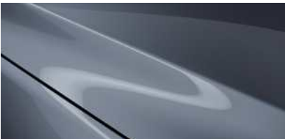
Polymetal Gray (47C)*