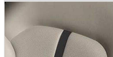
*עור בגוון בז' בשילוב סידור 7 מקומות בלבד