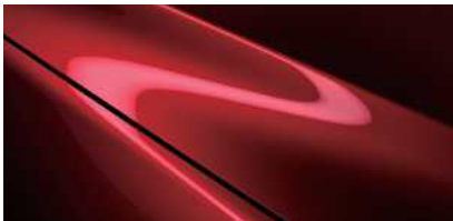
Soul Red (46V)*