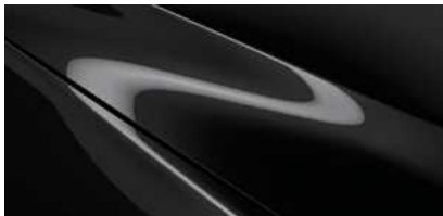
Jet Black (41W)*