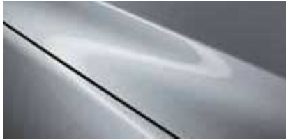
כסף סוניק (45P)