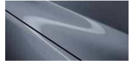
כחול מתכתי (47C)