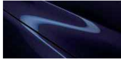
כחול קריסטל כהה (42M)