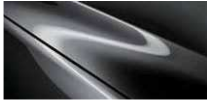
אפור עשיר (46G)*