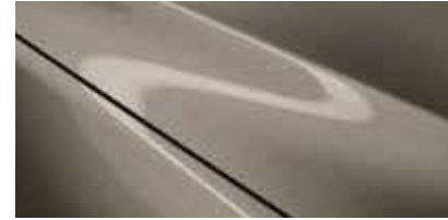
זהב מדברי (48T)