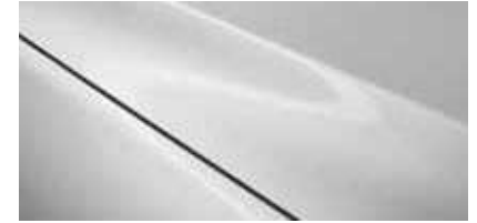
לבן עשיר (51K)*

* צבע בתוספת תשלום לתשומת ליבך! דוגמאות הצבעים, הריפודים והחישוקים בעלון זה מוצגות לשם המחשה בלבד. בשל מגבלות הדפוס, תתכנה סטיות מהצבעים והחומרים בפועל. היצע הצבעים כפוף לשינויים אפשריים על פי מדיניות היצרן ולמגבלות המלאי. פנה לנציג מכירות לקבלת מידע עדכני.