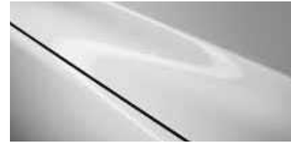
לבן ארקטי (A4D)