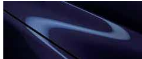
כחול קריסטל כהה (42M)