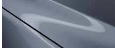
כחול מתכתי (47C)