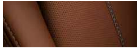
ריפוד עור Nappa חום במהדורת Special Edition