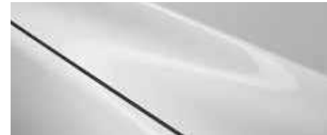
לבן פנינה (25D)