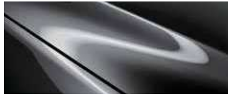
אפור עשיר (46G)*