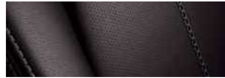
ריפוד עור שחור