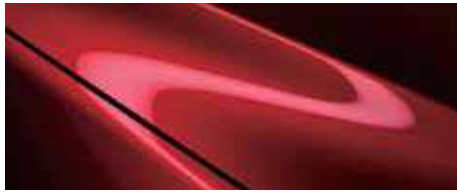
אדום עשיר נוצץ (46V)*