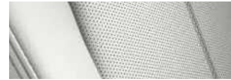
ריפוד עור Nappa לבן במהדורת Special Edition