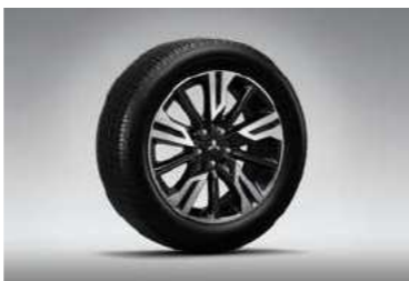
חישוקי סגסוגת 18" בכל הדגמים