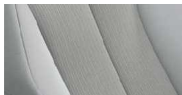
בד אפור מהודר**