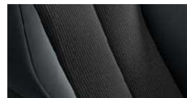
בד שחור מהודר**