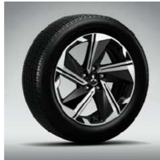
סגסוגת קלה 18"