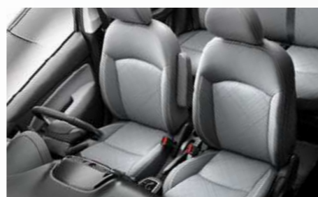
דמוי עור אפור בשילוב בד*