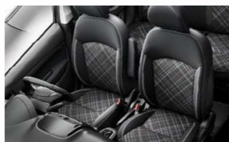
דמוי עור שחור בשילוב בד*