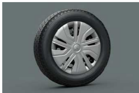
14": חישוקי פלדה בדגם INSTYLE