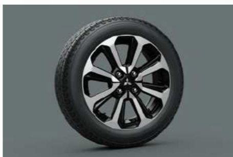
15": חישוקי סגסוגת קלה בדגמי SUPREME ו-1 PREMIUM