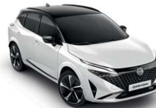
לבן פנינה מטאלי עם גג שחור (XAJ)