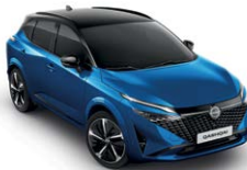
כחול רויאל מטאלי עם גג שחור (XGZ)