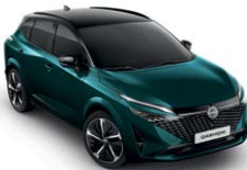
אמרלד ירוק מטאלי עם גג שחור (YBJ)