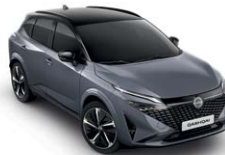
אפור פנינה מטאלי עם גג שחור (XEX)