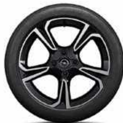
חישוקי סגסוגת 17" לדגמי GS Line ו-Elegance