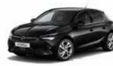
Black Perla | שחור מטאלי