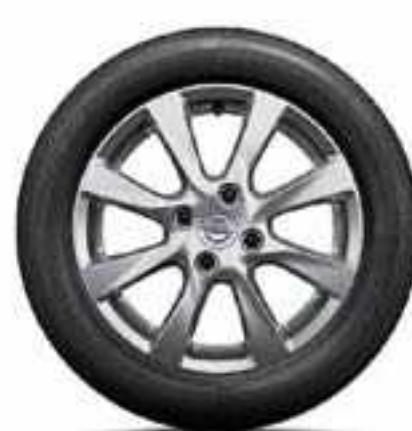
חישוקי סגסוגת 16" לדגמי Edition