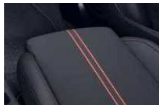
ריפוד בד שחור בשילוב פס אדום – "Banda" לדגמי GS Line