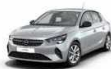
Aluminium Grey | כסוף מטאלי (בדגמי e-Elegance ו-Edition בלבד)