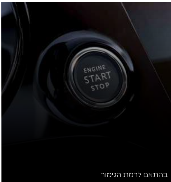
בהתאם לרמת הגימור