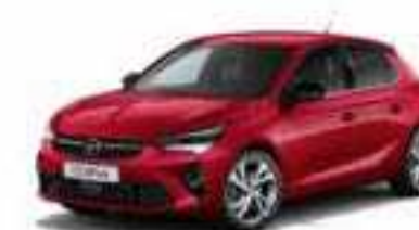
Peperoncino Red | אדום מטאלי