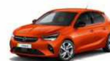
Orange Fizz | כתום מטאלי (בדגמי E-Elegance ו-Edition בלבד)