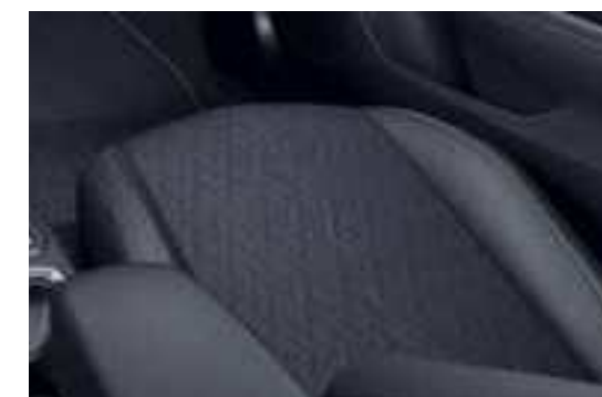
ריפוד משולב בד ועור מלאכותי – "Imagination" לדגמי Edition