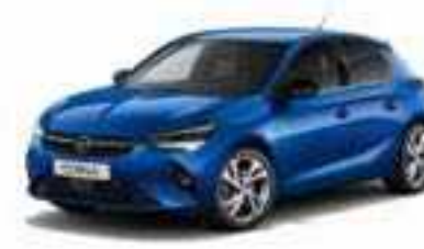
Voltaic Blue | כחול בהיר מטאלי (בדגמי E-Elegance ו-Edition בלבד)