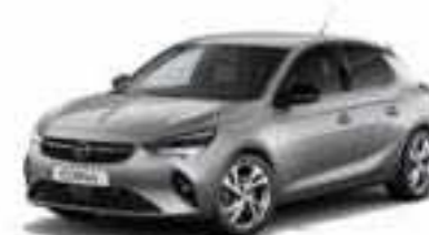
Artense | כסוף כהה מטאלי (בדגם GS Line בלבד)