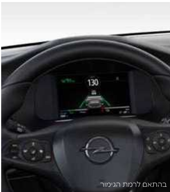
בהתאם לרמת הגימור