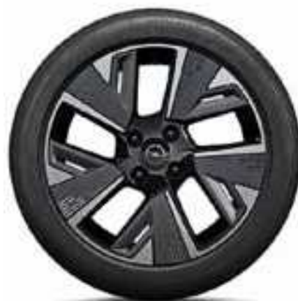
חישוקי סגסוגת 17" לדגמי e-Elegance