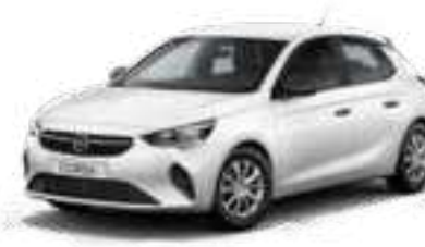
Polar White | לבן בנקיז