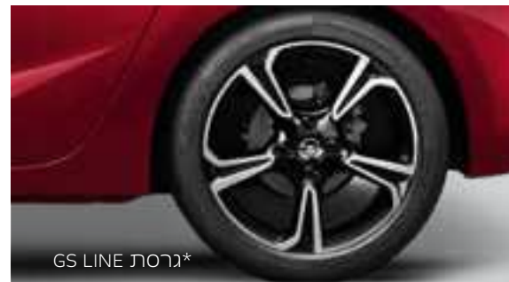
*גרסת GS LINE