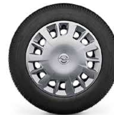
חישוקי פלדה 16" לדגמי EDITION PLUS 5 מושבים