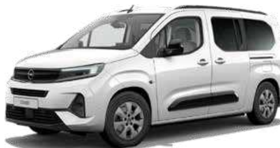
רמת גימור ELEGANCE PLUS – 7 מושבים