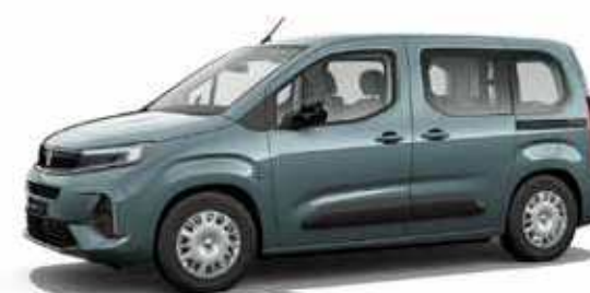
Libeccio Blue כחול מטאלי