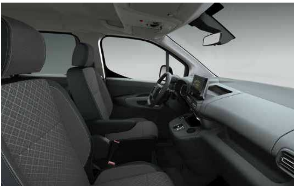
ריפוד בד בצבע אפור משולב עם שחור