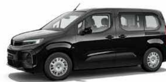
Perla Black שחור מטאלי