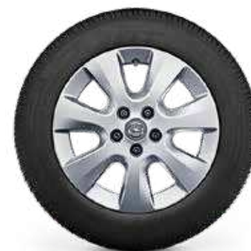
חישוקי סגסוגת 16" לדגמי ELEGANCE PLUS 7 מושבים