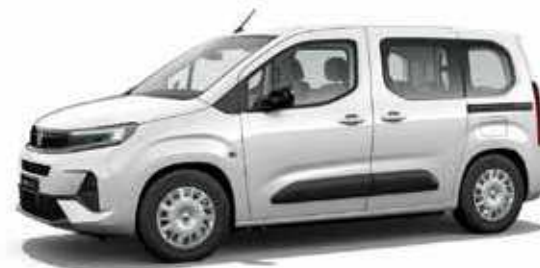
Icy White לבן