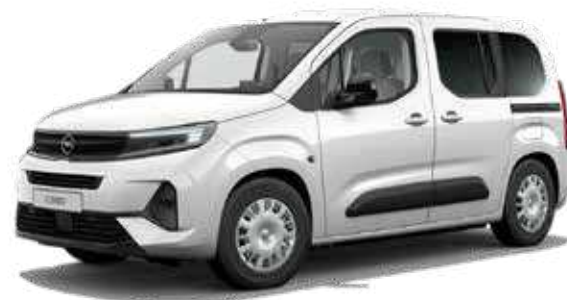
רמת גימור EDITION PLUS – 5 מושבים