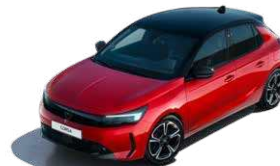
אדום מטאלי | Chili Red