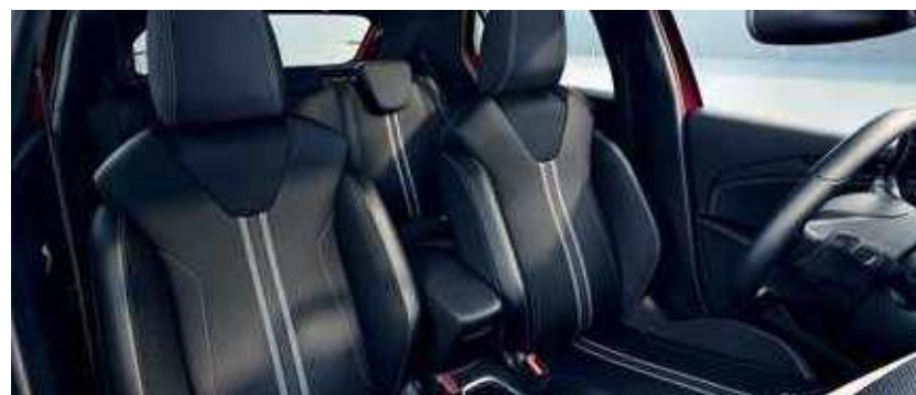
ריפוד משולב בד ועור מלאכותי בצבע שחור עם פס אפור