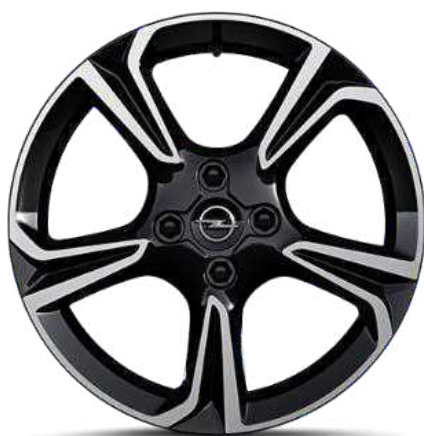
חישוקי סגסוגת 17"