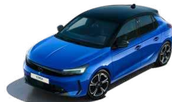
כחול מטאלי | Volatic Blue