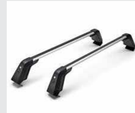
מוטות רחב (על גג הרכב)