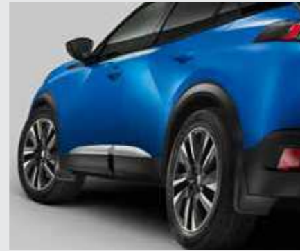
סט מגני בוץ (קדמיים + אחוריים)