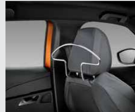
סט קולבים למשענות הראש הקדמיות