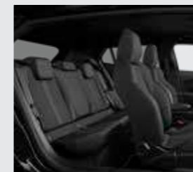
GT (ריפוד בצבע אפור משולב דמוי עור)