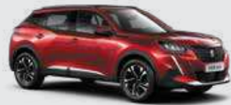
אדום מטאלי ELIXIR RED | VHMS