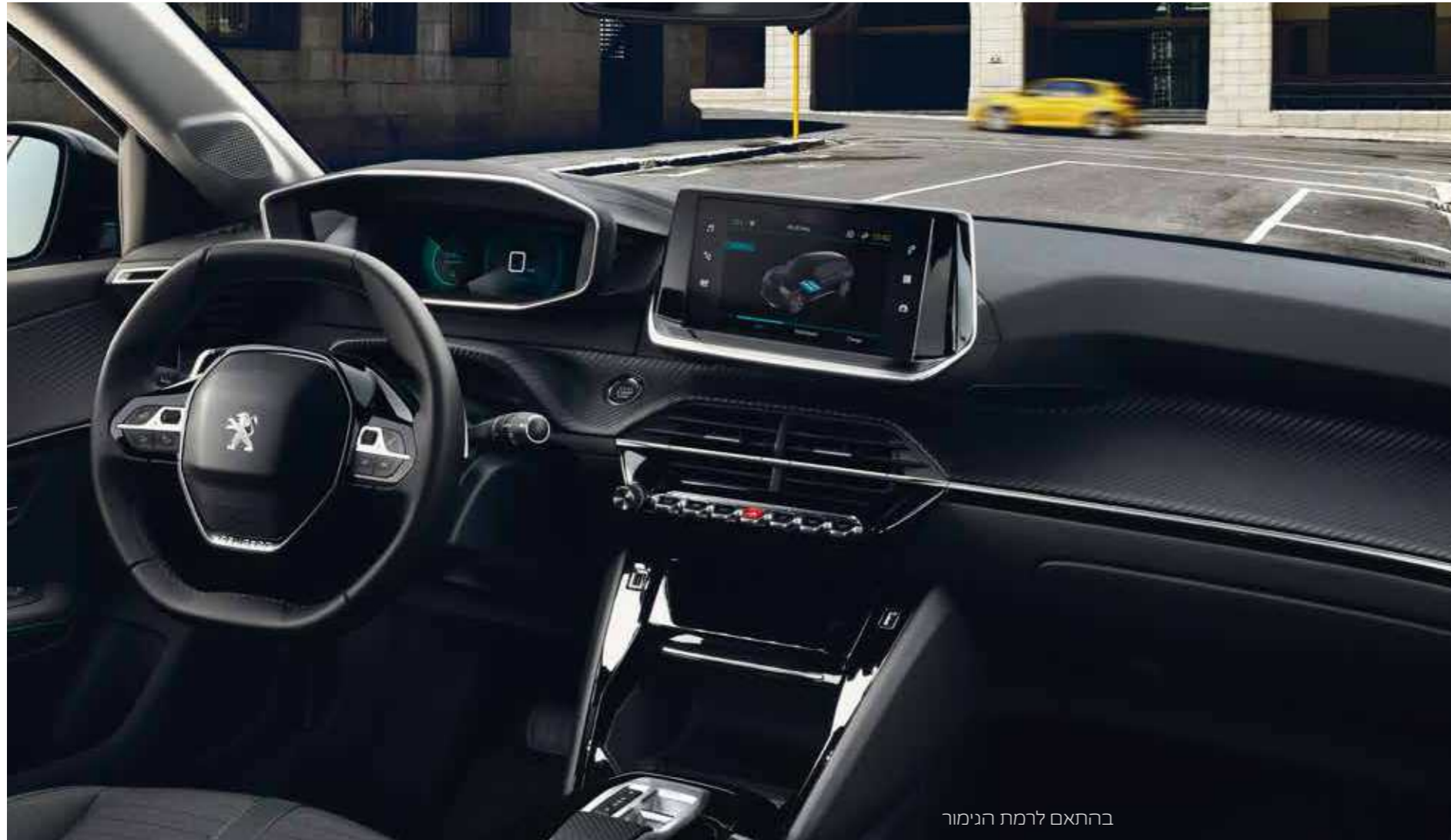
בהתאם לרמת הגימור