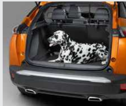
גריל הפרדה לתא מטען