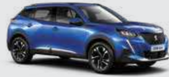
כחול פנינה מטאלי VERTIGO BLUE | SMM6