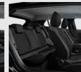
ACTIVE (ריפוד אפור כהה)