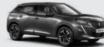
אפור כהה מטאלי PLATINIUM GREY | VLMO