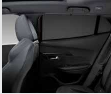
סט רשתות הצלה*