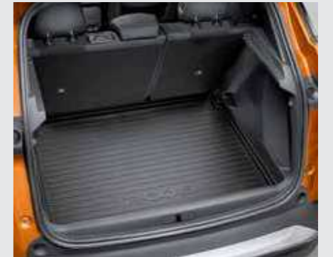
משטח פלסטיק לתא מטען

*לדגמי Active. **לדגמי אקטיב ופרימיום בלבד. ***אביזר לא מקורי. כל האביזרים המופיעים הינם בתשלום נוסף.