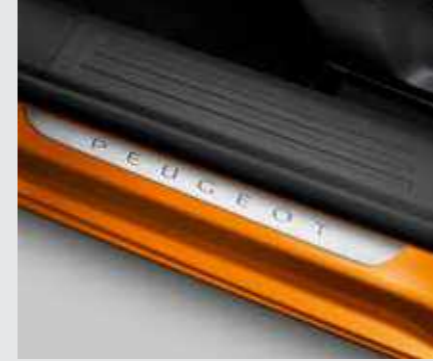
סט ספי דלת**