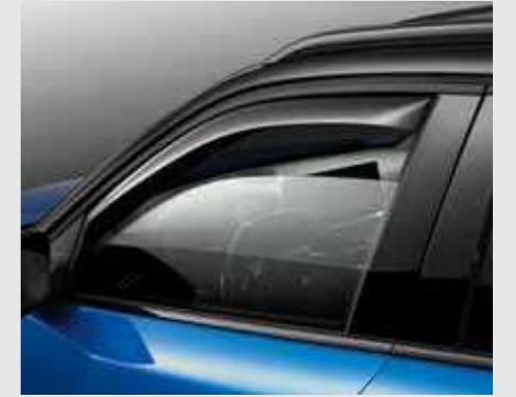
סט מסיטי רוח לחלונות הקדמיים