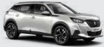
לבן פנינה מטאלי PEARLESCENT WHITE | N9M6

לרשותך עומד מגוון רחב של צבעים שיאפשר לך להביע את עצמך באופן מלא.