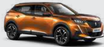
כתום מטאלי ORANGE FUSION | 2SM0