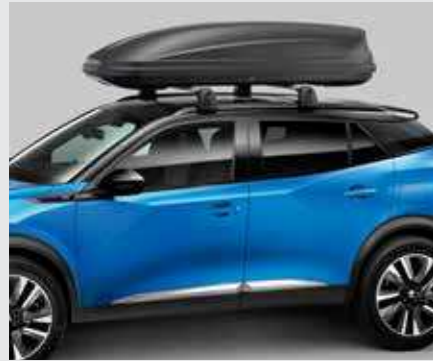
מגוון תאי אחסון עילאיים לבחירה