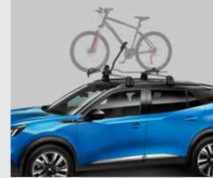
מנשא לאופניים (נדרש מוטות רחב)