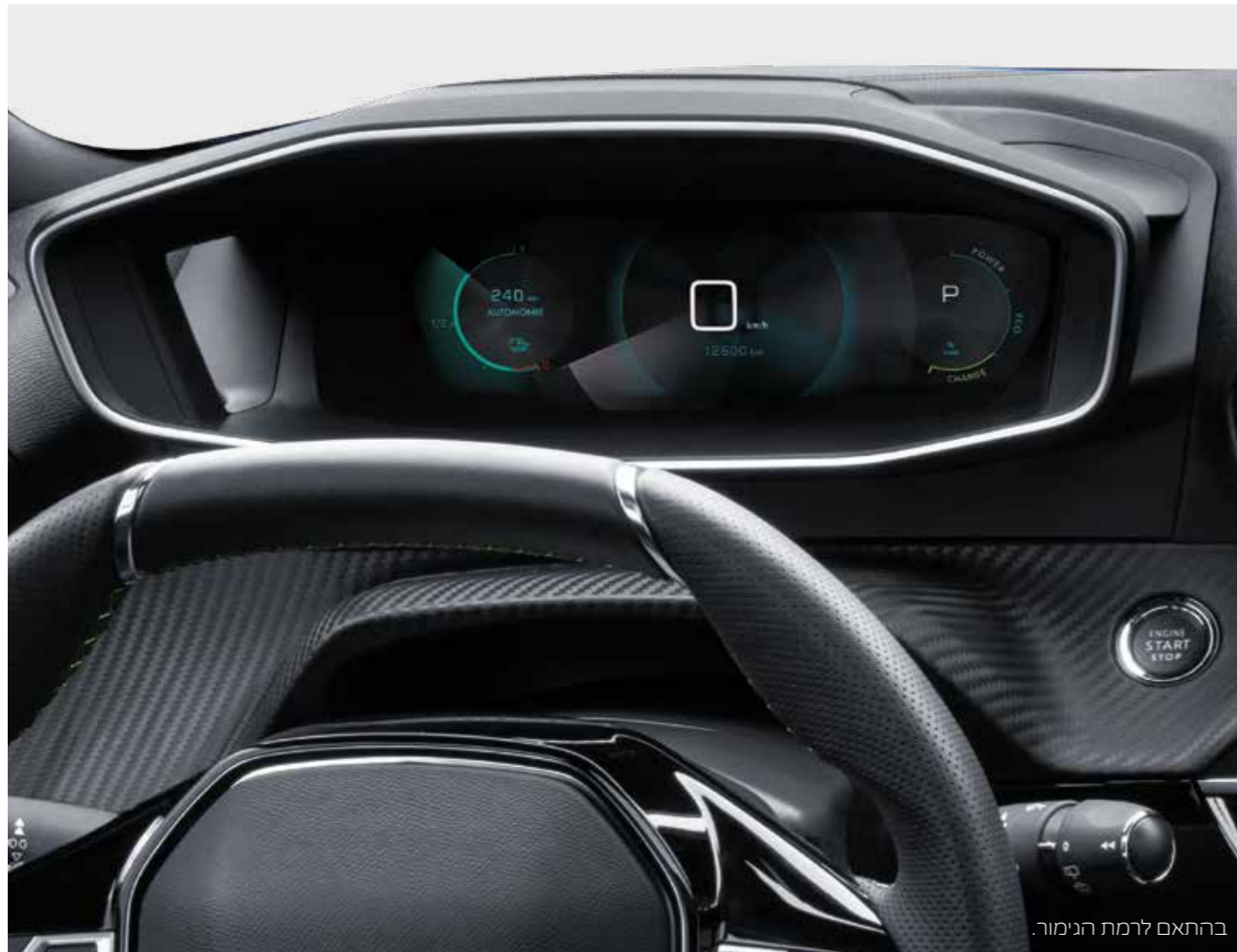
בהתאם לרמת הגימור.