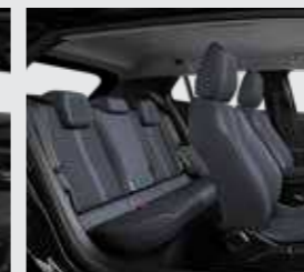
PREMIUM (ריפוד אפור-שחור עם תפר טורקיז)