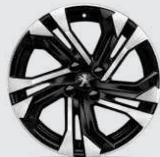
חישוקי סגסוגת 17" SALAMANCA בדגמי PREMIUM/GT