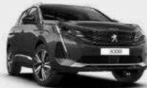
אפור כהה מטאלי PLATINIUM GREY | VLM0