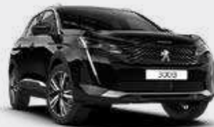
שחור מטאלי BLACK PERLA | 9VM0

לרשותך עומד מגוון רחב של צבעים שיאפשר לך להביע את עצמך באופן מלא.