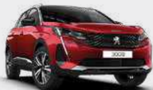
אדום מטאלי ULTIMATE RED | F3M5