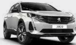
לבן פנינה מטאלי PEARLESCENT WHITE | N9M6