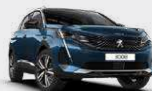
כחול בהיר מטאלי CELEBES BLUE | SYM0