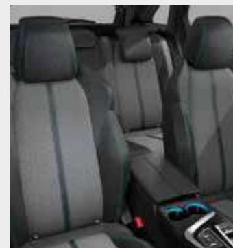
PREMIUM ריפוד בד בצבע אפור בהיר בשילוב דמוי עור