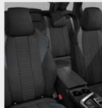
ACTIVE PACK ריפוד בד בצבע אפור כהה (בהתאם לזמינות המלאי)