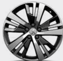
חישוקי סנסוגת 18" ACTIVE PACK בדגמי PREMIUM-I