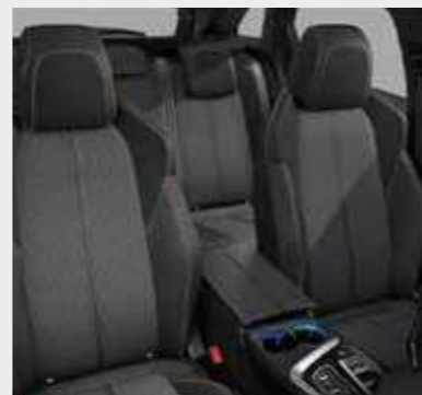
GT ריפוד בד בצבע אפור בשילוב דמוי עור