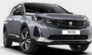
כסוף כהה מטאלי ARTENSE GREY | F4M0