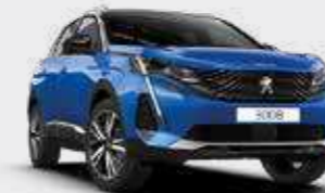
כחול פנינה מטאלי VERTIGO BLUE | SMM6

*צבע מטאלי בתוספת תשלום (למעט כחול בהיר)