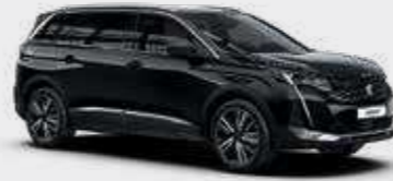
שחור מטאלי BLACK PERLA | 9VM0