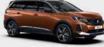
חום מטאלי METALLIC COPPER | LGM0

*צבע מטאלי בתוספת תשלום (למעט כחול בהיר)