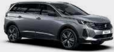
כסוף כהה מטאלי ARTENSE GREY | F4M0

לרשותך עומד מגוון רחב של צבעים שיאפשר לך להביע את עצמך באופן מלא.