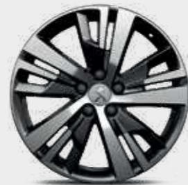
חישוקי סגסוגת 18" DETROIT

*צבע מטאלי בתוספת תשלום (למעט כחול בהיר)