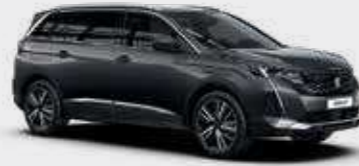
אפור כהה מטאלי PLATINIUM GREY | VLM0