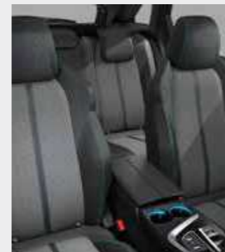
PREMIUM ריפוד בד בצבע אפור בהיר בשילוב דמוי עור