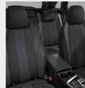
ACTIVE PACK ריפוד בד בצבע אפור כהה (בהתאם לזמינות המלאי)