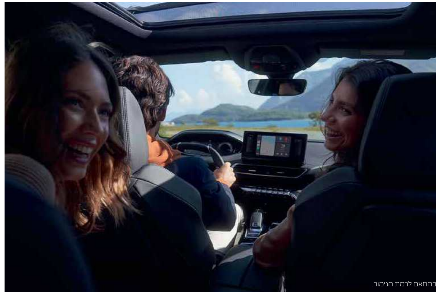
בהתאם לרמת הגימור.

הפנס האחורי המופיע בתמונות הינו להמחשה בלבד ושונה מזה שיספק עם הרכב.