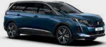
כחול בהיר מטאלי CELEBES BLUE | SYM0