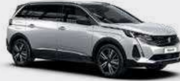
לבן פנינה מטאלי PEARLESCENT WHITE | N9M6