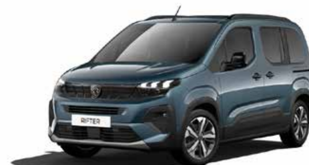
LIBECCIO BLUE - כחול כהה מטאלי