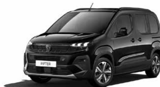
PERLA NERA BLACK - שחור מטאלי