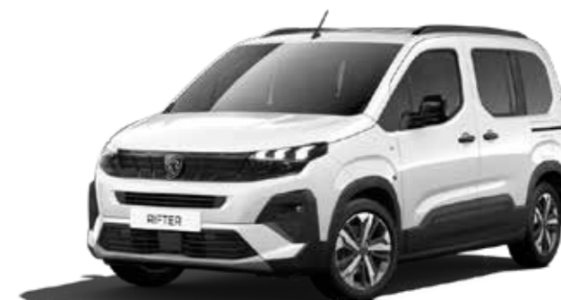
WHITE ICY - לבן