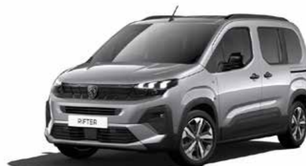
ARTENSE GREY - כסוף כהה מטאלי