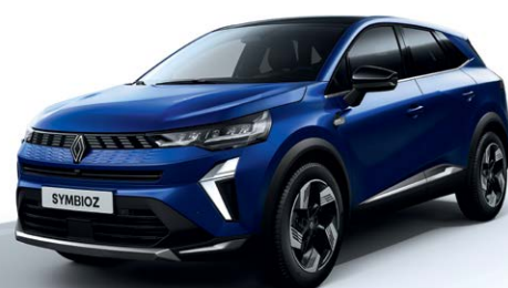
כחול עמוק מטאלי RQH