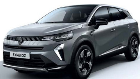
אפור בטון מטאלי KNJ