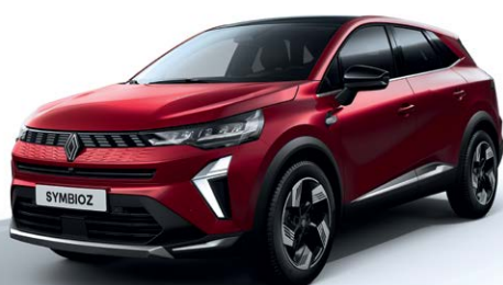
אדום מטאלי NNP