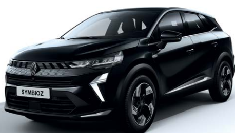
שחור מטאלי GNE