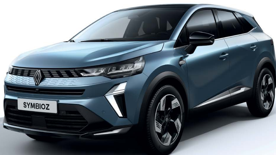
כחול טורקיז מטאלי RRM